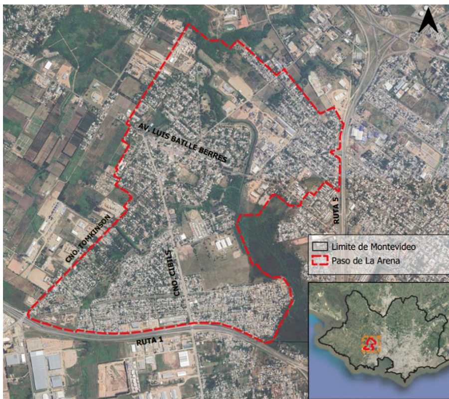
Figura 2. Ubicación barrio Paso de la Arena, Montevideo.