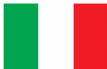
Fondo Italiano para el Desarrollo Sustentable de la República Argentina