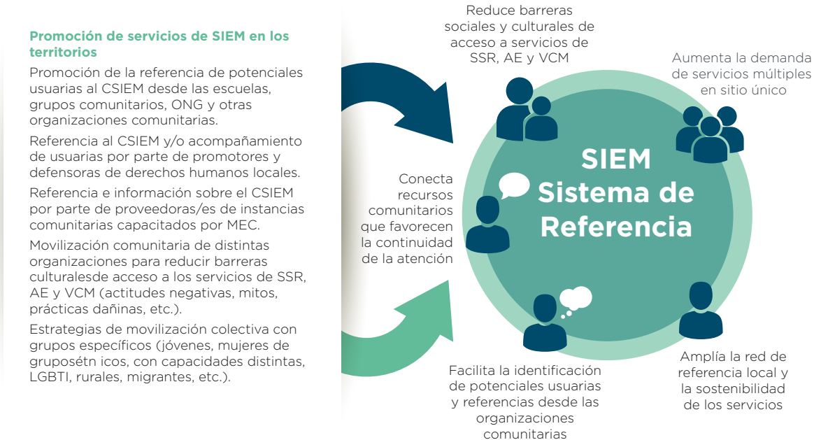
Figura 1. Educación Colectiva y Sistema de Referencia del SIEM

El personal del MEC participa en actividades de capacitación y reflexiones grupales y difusión de los servicios del SIEM en las comunidades, por lo que su perfil debe incluir capacidades para el uso de metodologías participativas y de coordinación interinstitucional.