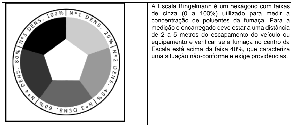
Figura 2 – Escala Ringelmann

Para o monitoramento e controle da emissão de fumaça será utilizada a Escala Ringelmann (figura a seguir). Quando a concentração estiver acima de 40%, deverão ser exigidas providências de melhoria e ajustes nos veículos e equipamentos.