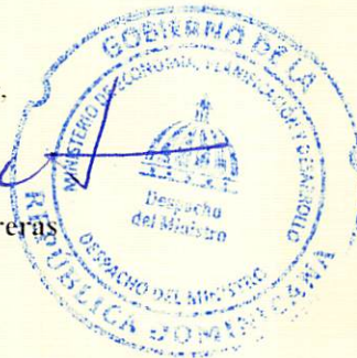
Pavel Isa Contreras Ministro