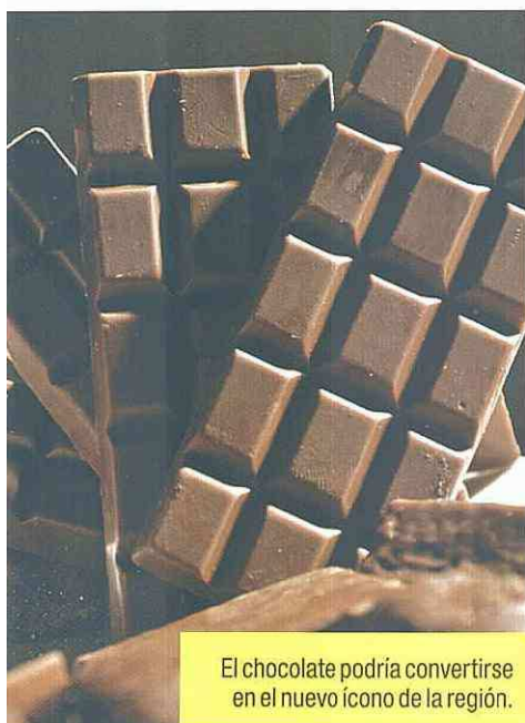
El chocolate podría convertirse en el nuevo ícono de la región.