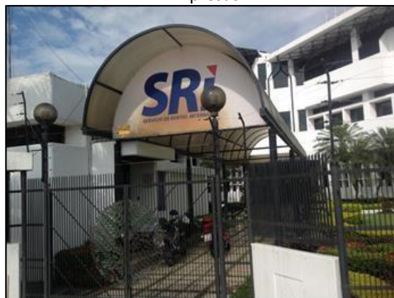
Organismos de control