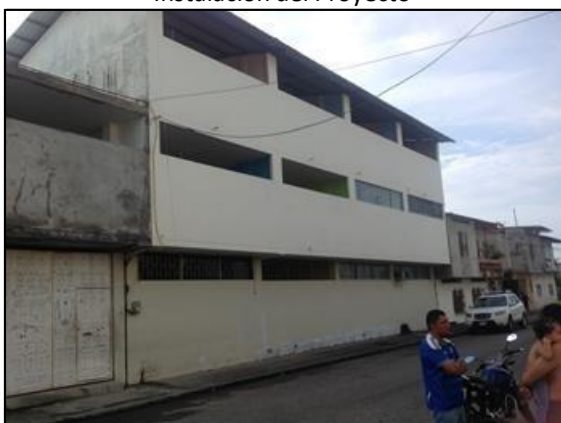
Centro Educativo Rey David