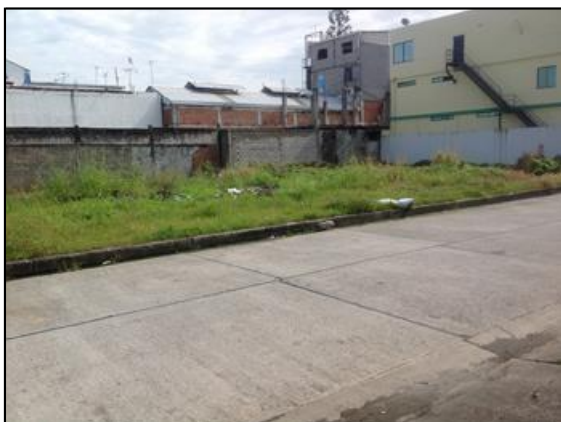
Instalación del Proyecto