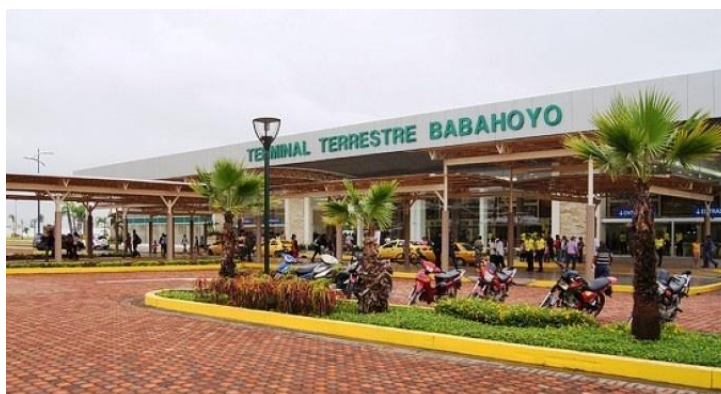
Figura No. 1: Edificio de la Terminal Terrestre Babahoyo

Se sugiere la realización del Proceso de Participación Social en la sala de actos de la Terminal Terrestre ubicado en la vía Juján Babahoyo, por tener un local que cuenta con un espacio amplio para 60 personas cómodamente sentadas. Se sugiere realizar el proceso para el día sábado a las 15:00 horas , con la siguiente agenda: