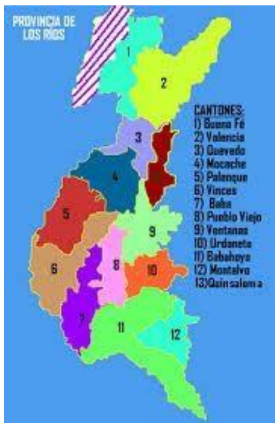
Figura No. 1: Ubicación Geográfica