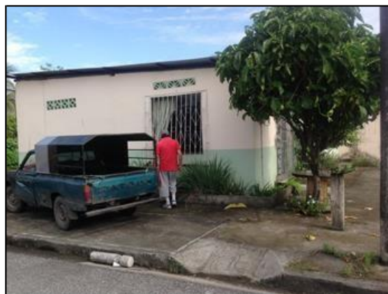
Verificando actores sociales