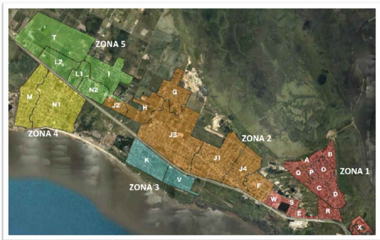
Localización de zonas de saneamiento