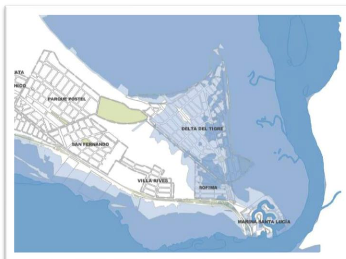
Áreas afectadas por niveles de marea de Tiempo de Recurrencia 10 y 100 años

bordea al barrio Delta del Tigre, pero este no proporciona un nivel de protección suficiente, presenta diferentes alturas, y en la mayor parte de los tramos por debajo de los niveles correspondientes a eventos de crecida extremos de 100 años de período de retorno.