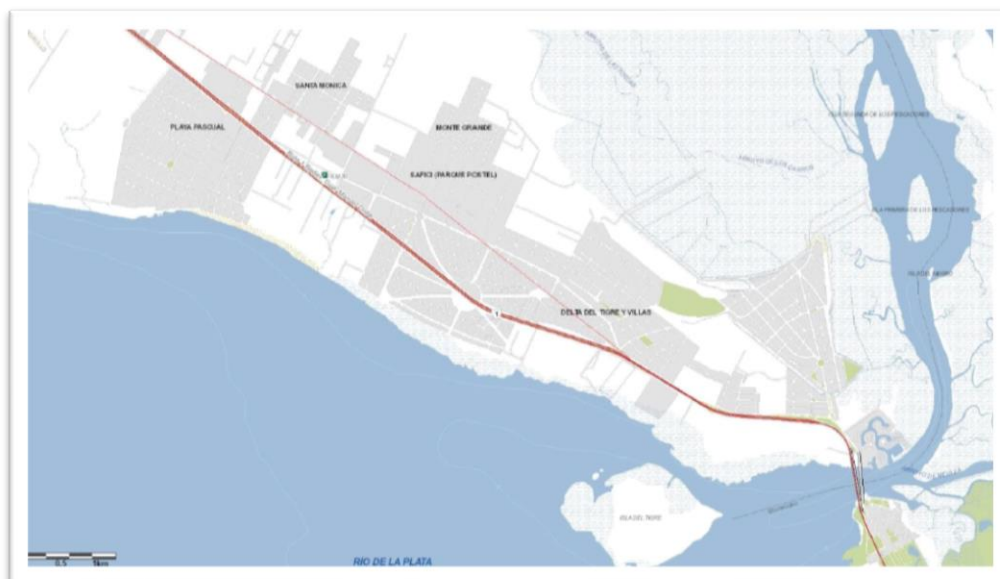
Cursos fluviales en la región

La cuenca del Río Santa Lucía es de importancia estratégica para la sociedad uruguaya, ya que es la principal fuente de abastecimiento hídrico. A través de captaciones a lo largo de su cuenca, provee de agua potable al 60 % de la población de todo el país, incluyendo el área metropolitana de Montevideo. En el subsuelo de parte de esta cuenca se localiza el acuífero Raigón, del cual se extrae agua mediante pozos para el consumo humano, consumo animal, y también para el riego y abastecimiento de las industrias. En la cuenca inferior del río se extienden los humedales del Río Santa Lucía. Estos conforman un ecosistema de relevancia por la gran diversidad de especies animales y vegetales presentes, y porque cumplen una gran variedad de funciones ambientales. Una característica de estos humedales es que son salinos, influenciados por la marea eólica procedente del Río de la Plata.