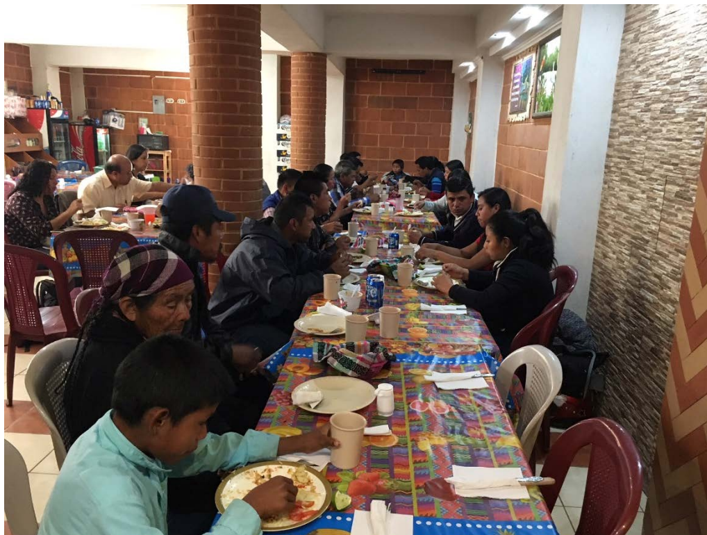
Consulta significativa comunidades de Cucal y Xepón Chiquito, Malacatancito, Huehuetenango, 7 de agosto de 2018.