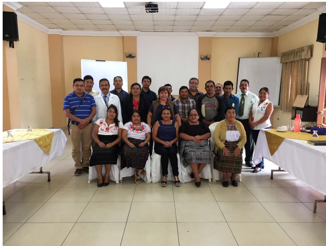
Consulta significativa Hospital Departamental de Huehuetenango, 6 de agosto de 2018.