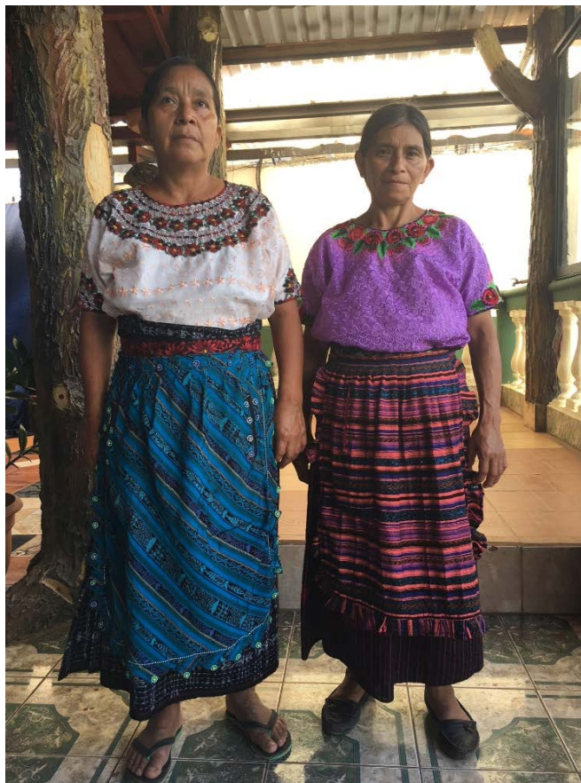
Arriba director del Hospital Distrital de Malacatán; abajo comadronas de la Casa Materna Rural de Pueblo Nuevo (Tajumulco), Consulta significativa Hospital Distrital de Malacatán, 2 de agosto de 2018.