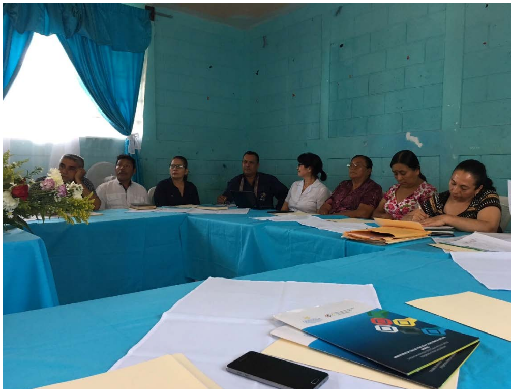
Consulta Hospital Distrital Malacatán, 2 de agosto de 2018.