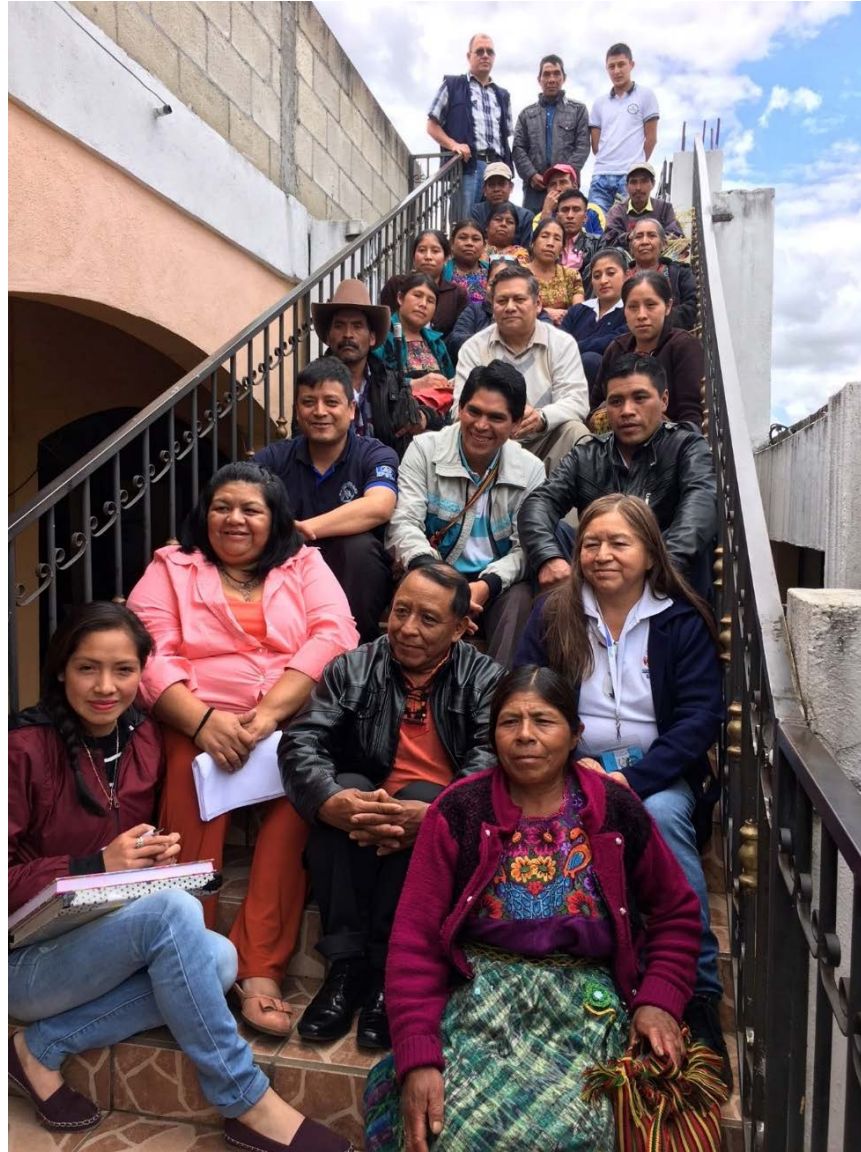
Consulta Comitancillo, San Marcos, 1 de agosto 2018.