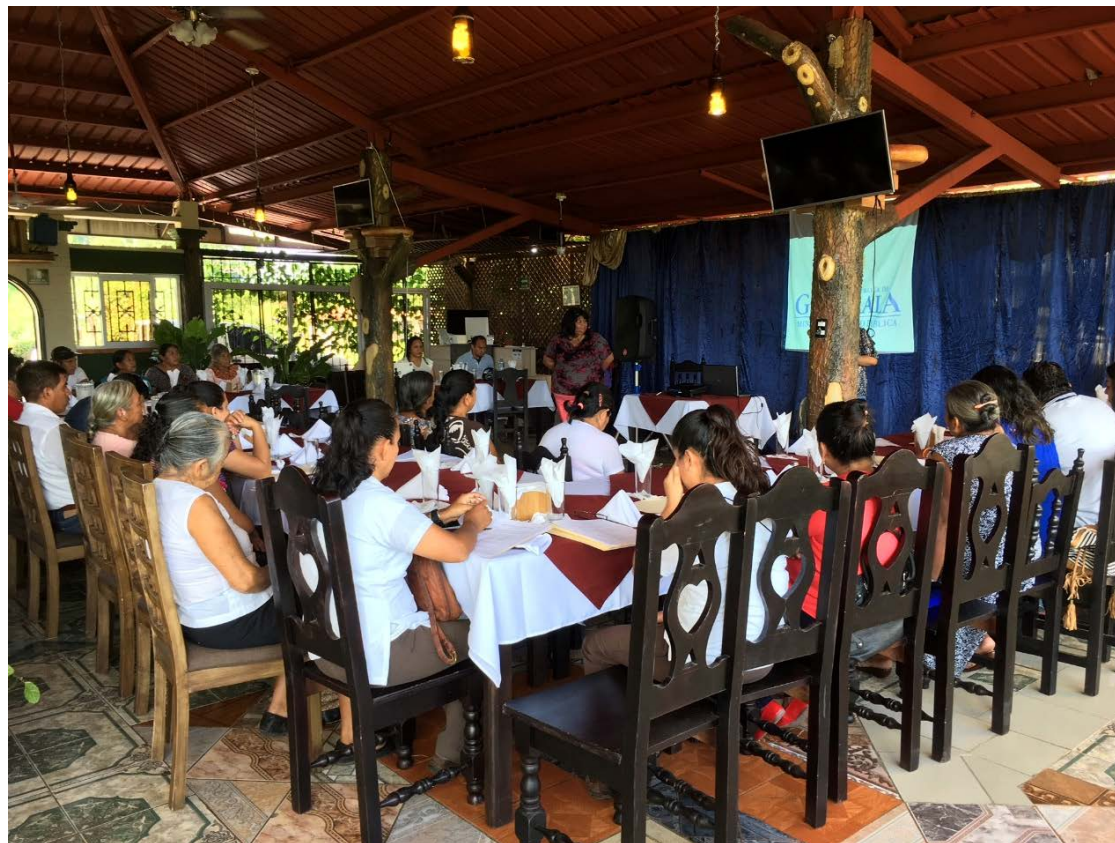
Consulta significativa comunidades de Tocaché y San José Zelandia (San Pablo), Pueblo Nuevo (Tajumulco) y Puesto de Salud Malacatán, Malacatán, 3 de agosto de 2018.