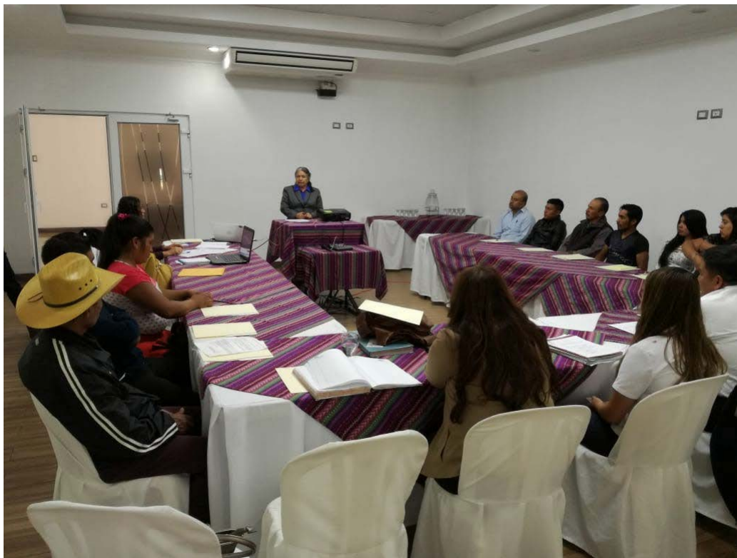
Consulta con representantes comunitarios y autoridades de salud de Suculque y Chivacabe, Distrito Sur Huehuetenango, 10 de agosto de 2018.