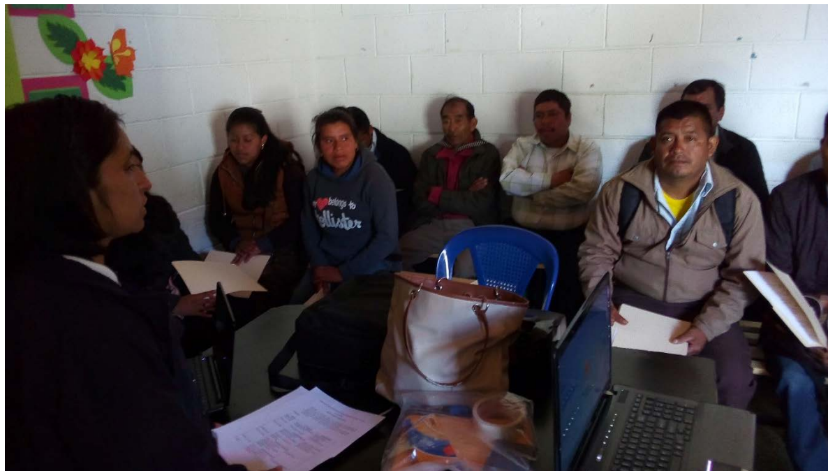
Representantes de las comunidades de Ixquebaj y Lolbatzam, San Sebastián Coatán, Huehuetenango, 8 de agosto de 2018.