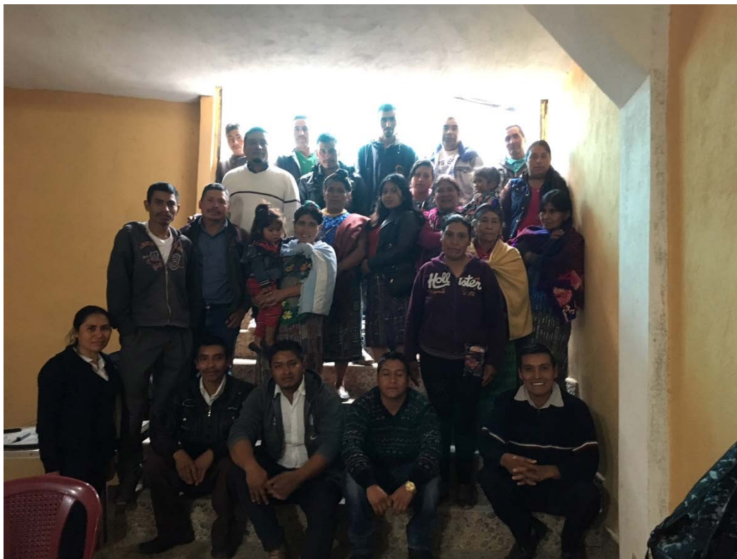
Arriba y abajo autoridades comunitarias, comadronas y trabajadores de salud de las aldeas Ajul y Bacú, Concepción Huista, Huehuetenango, 8 de agosto de 2018.