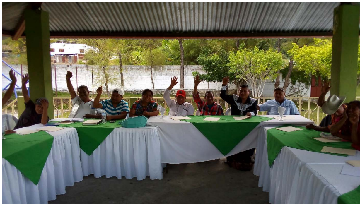
Consulta significativa con representantes de las comunidades de Xenaxicul y Río Blanco Chiquito, Aguacatán, Huehuetenango, 9 de agosto de 2018.