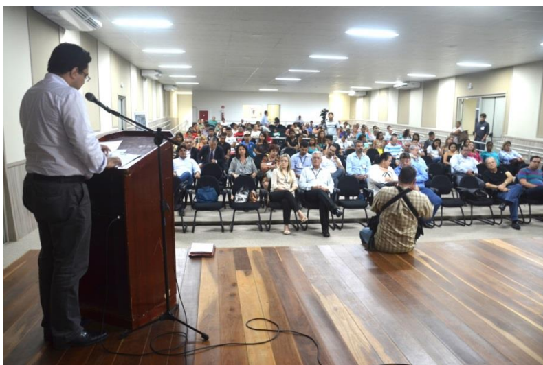
Figura 7 – Momento da fala do Secretário Municipal de Planejamento, Orçamento e Gestão.