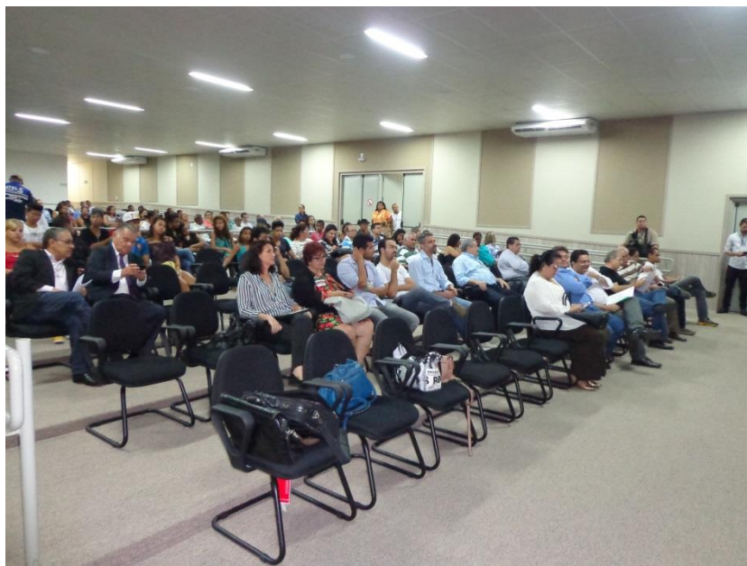
Figura 9 – Foto do público presente na Consulta Pública.

Na Figuras 10 e 11 se apresentam imagens do público presente no auditório onde a Consulta Pública se realizou.