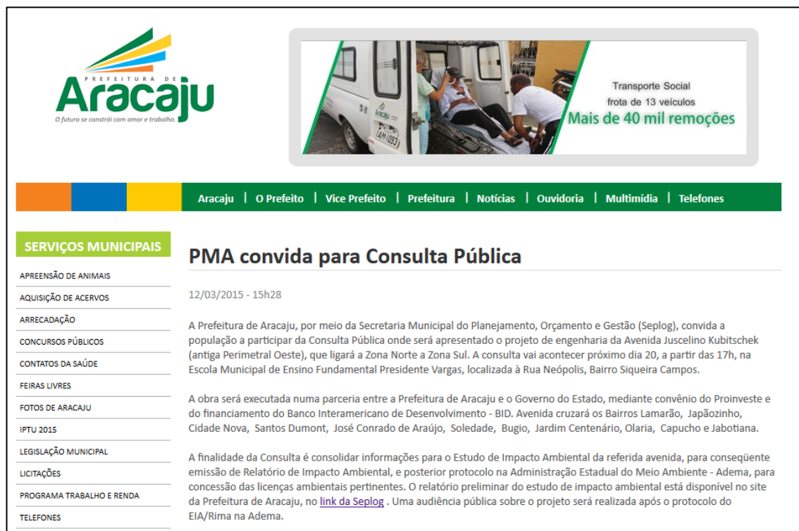
Figura 5– Publicização da Consulta Pública do EIA/RIMA da Avenida Juscelino Kubistchek.