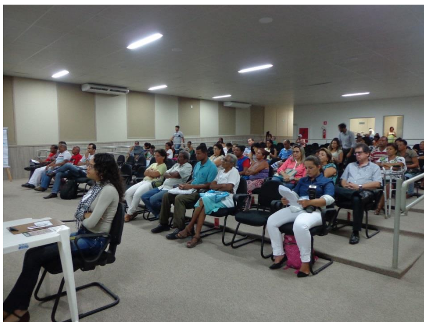
Figura 10 – Foto do público presente na Consulta Pública.

No final da sessão plenária foi informado um endereço de correio eletrônico para o qual os interessados poderiam ainda enviar suas contribuições durante 5 dias úteis, além de também poderem fazer por escrito. No entanto não foram rececionados quaisquer contribuições por correio eletrônico.