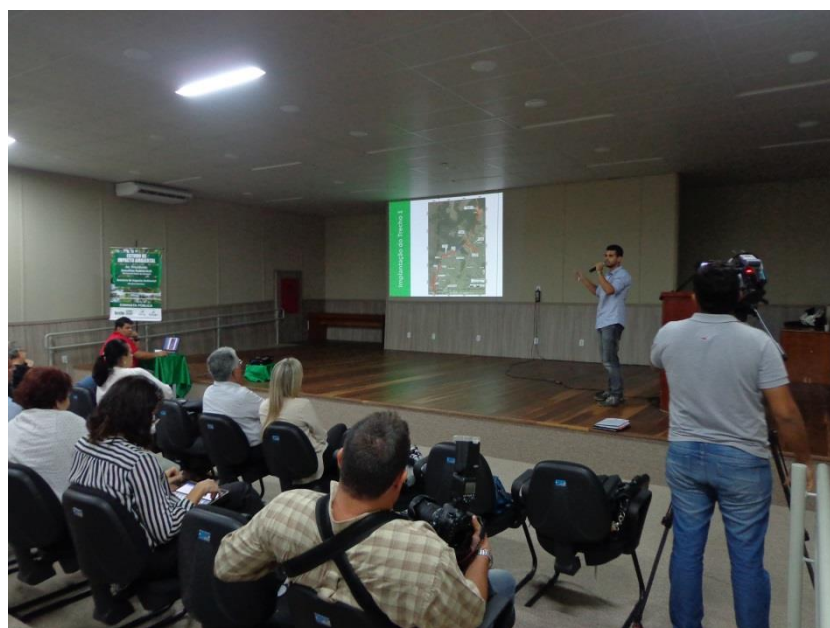
Figura 9 – Momento da fala representante da TERRAVIVA/IDAD – Apresentação do EIA/RIMA preliminar.