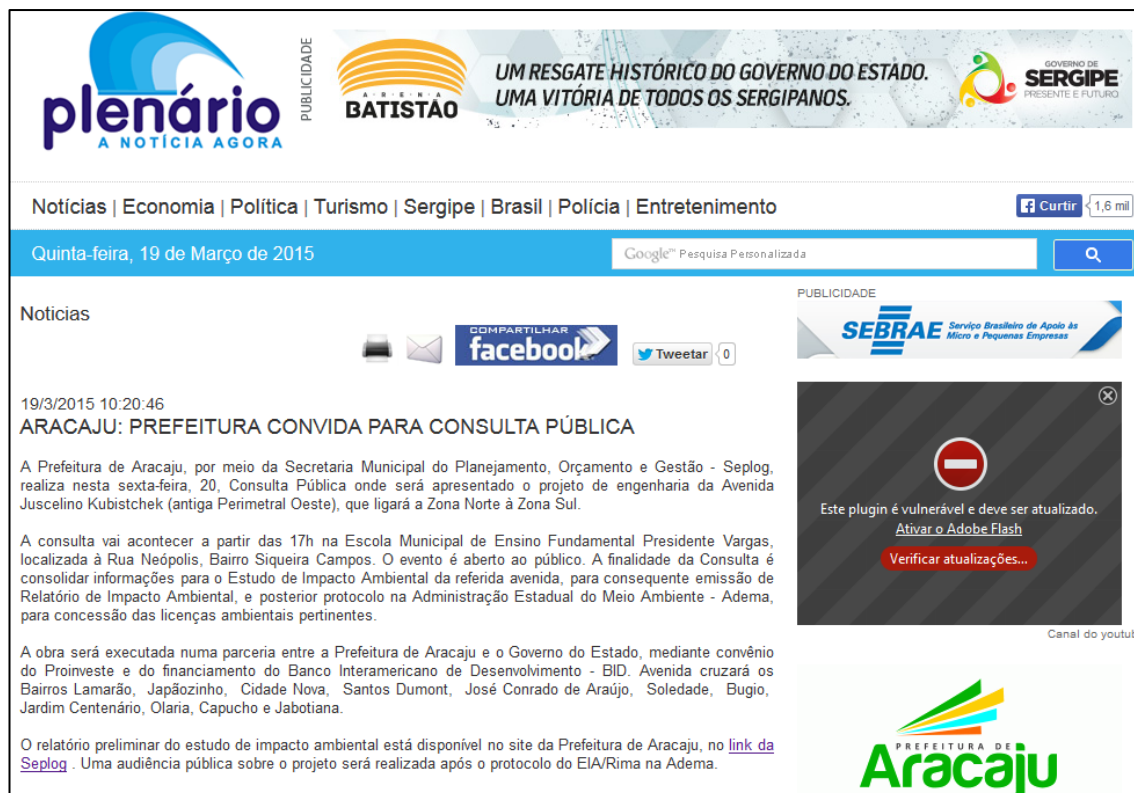
Figura 4– Publicização da Consulta Pública do EIA/RIMA da Avenida Juscelino Kubistchek.