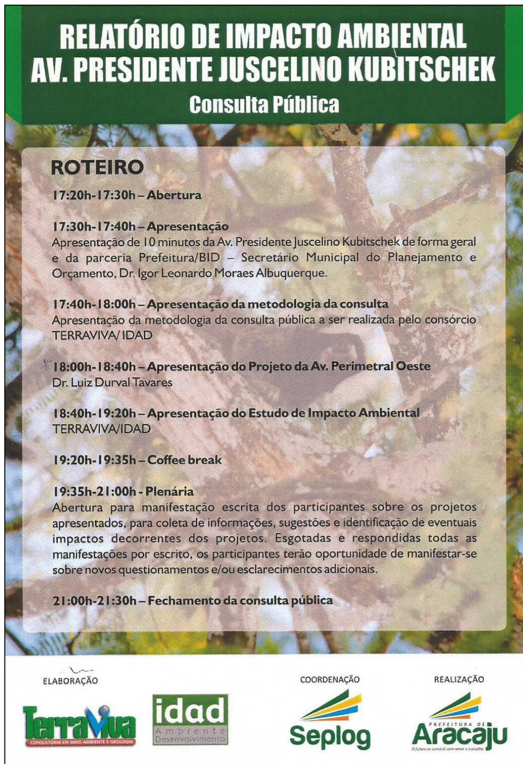
Figura 6– Roteiro da Consulta Pública.

Em seguida se apresenta o Roteiro da Consulta Pública.