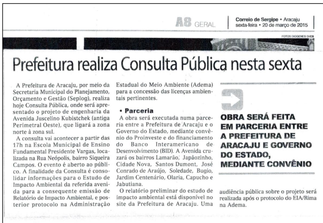
Figura 2– Publicização da Consulta Pública do EIA/RIMA da Avenida Juscelino Kubistchek.

Em seguida se apresentam algumas notícias da publicização da Consulta Pública nos meios de comunicação social.