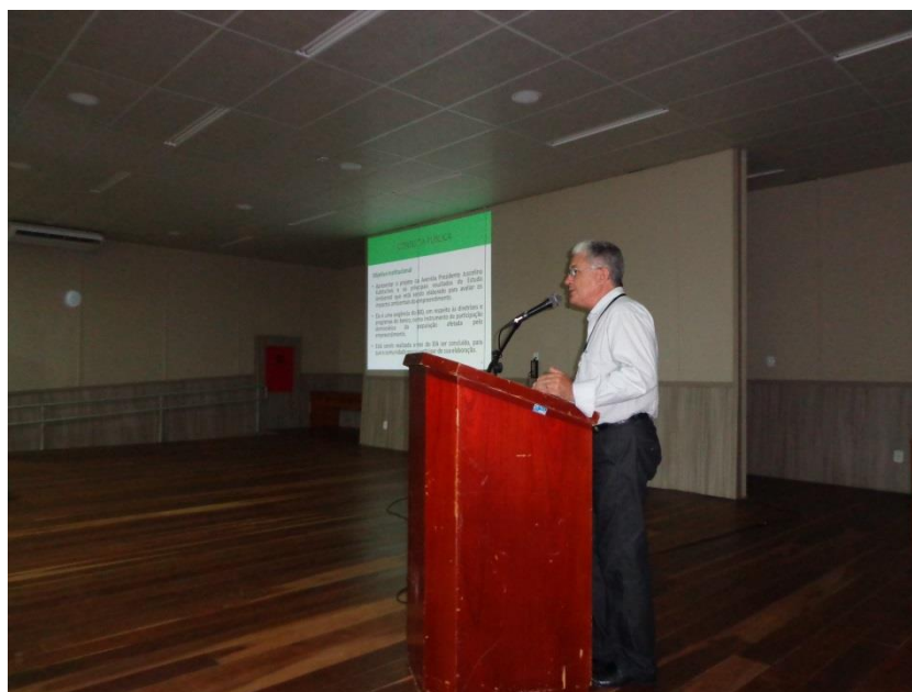
Figura 8 – Momento da fala representante da TERRAVIVA/IDAD: apresentação da metodologia da consulta.