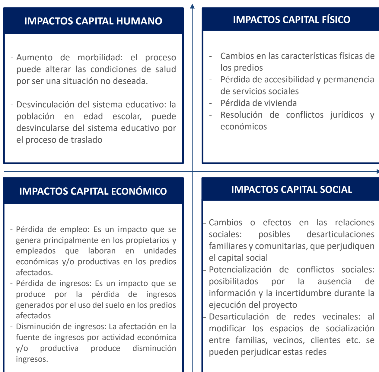
Ilustración 7.2 - Medios de Vida Sostenibles – Impactos sobre los Capitales