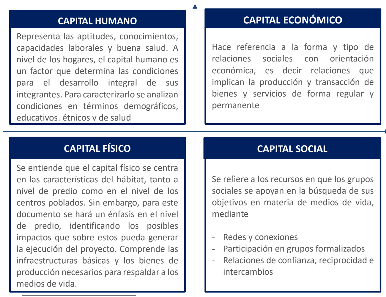
Ilustración 7.1 - Medios de Vida Sostenibles – Capitales

Los medios de vida sostenibles, se componen de cuatro capitales interrelacionados que definen las condiciones y potencialidades de los hogares para afrontar el proceso de reasentamiento, así: