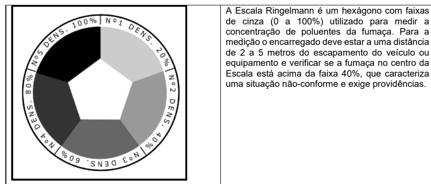
Figura 2 – Escala Ringelmann

Para a redução da poeira serão utilizados caminhões pipas para a aspersão de água nas vias. Para o monitoramento e controle da emissão de fumaça será utilizada a Escala Ringelmann (figura a seguir). Quando a concentração estiver acima de 40%, deverão ser exigidas providências de melhoria e ajustes nos veículos e equipamentos.