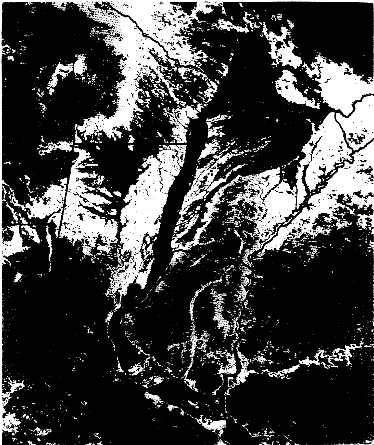
IMAGEN NOAA-AVHRR - MAYO 1998