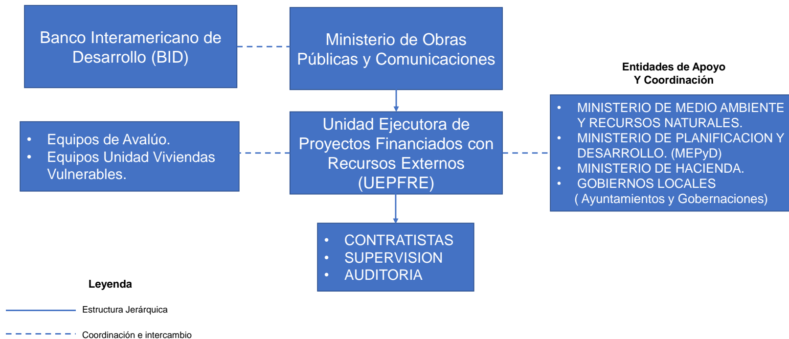
Figura 3.1.a Esquema General de Ejecución del Programa DR-L1151