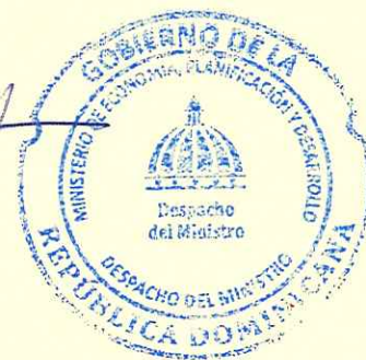
Pavel Isa Contreras Ministro