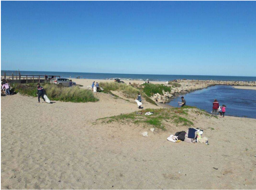
Imagen: Limpieza de Playas