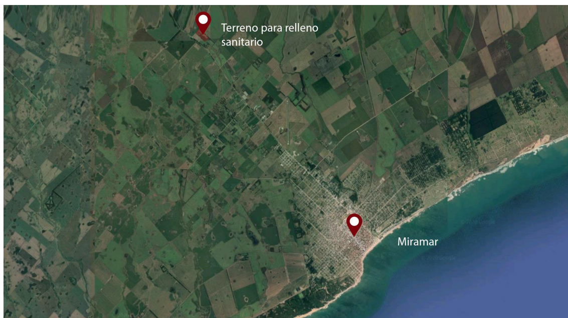
Ubicación predio relleno sanitario.

Actualmente el Municipio no cuenta con estaciones de transferencia. La disposición final de residuos se encuentra en la ciudad de Miramar (el cual recibe los desechos de las localidades de Miramar, Mar del Sud, Mechongué y Otamendi). este sitio se encuentra ubicado a 10 km del centro urbano en el predio denominado Santa Irene en dirección noroeste y se accede por la ruta provincial N° 77.