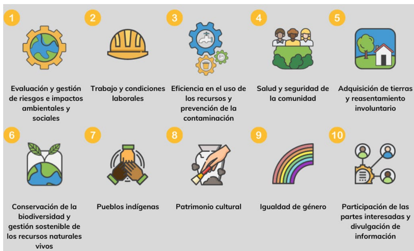
Figura 1 Normas de Desempeño Ambiental y Social

Dicho Plan forma parte del Sistema de Gestión Ambiental y Social (SGAS) e instrumentos de gestión ambiental y social del Programa, los que se encuadran en los requisitos establecidos en el Marco de Políticas Ambientales y Sociales (MPAS) del BID. Dicho marco comprende diez Normas de Desempeño Ambiental y Social (NDAS), y en particular el plan se vincula a las NDAS 1, 7, 8, 9 y 10.