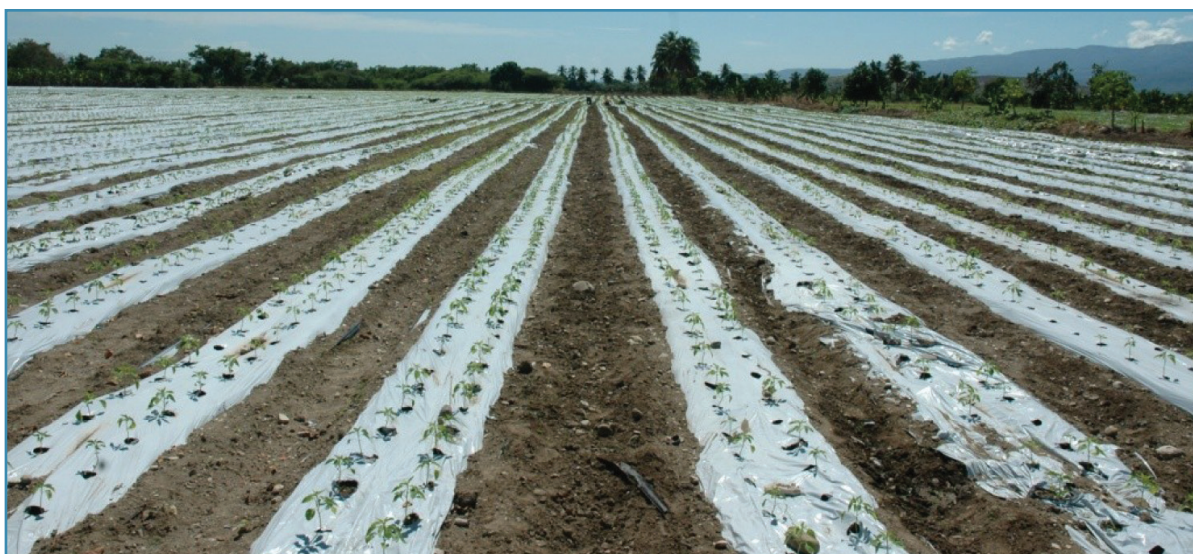
Tecnología de Riego por goteo y acolchado para el cultivo del Tomate Industria (Barceló)