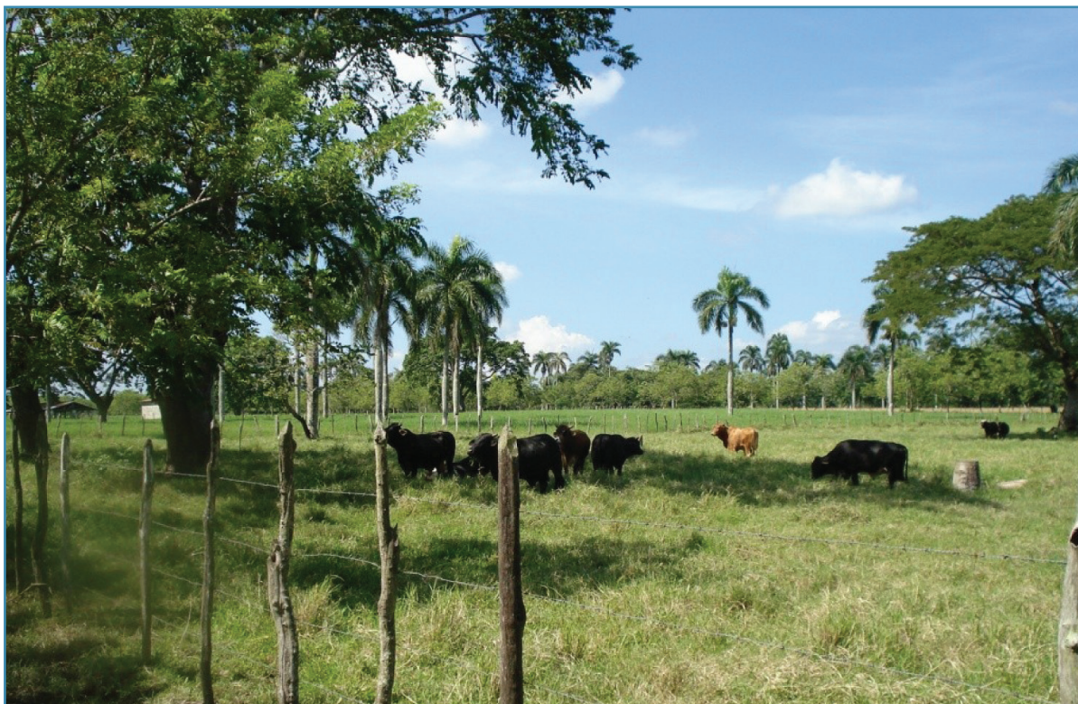
Tecnología de Rehabilitación y Mejoramiento de Pastos

estrecha comunicación directa e indirecta entre productores agropecuarios, proveedores, agentes técnicos, directivos del PATCA y personal de BANRESERVAS.