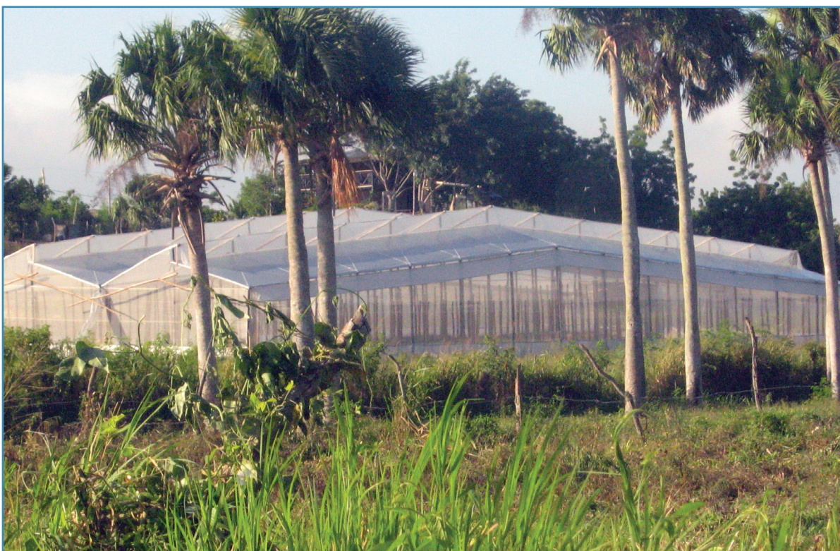
Estructura rústica en madera de la Tecnología de Cultivos Protegidos de 964 m 2 .

La meta básica del Componente era beneficiar a 10,500 productores al finalizar el proyecto en 2010, meta que fue sobrepasada al lograrse una entrega de 13,711 apoyos 3 al concluir el Programa. Para ello, se otorgaron apoyos tecnológicos hasta por un máximo de US$4,500 pagaderos a un productor individual para cubrir el costo total o parcial de la adopción de una o varias tecnologías 4 . Las superficies máximas a las que se orientaron los apoyos fueron hasta un máximo de 2 hectáreas a las tecnologías de riego, de 4 hectáreas a tecnologías para cultivos arbóreos/frutales y de 15 hectáreas a renovación de pastos.