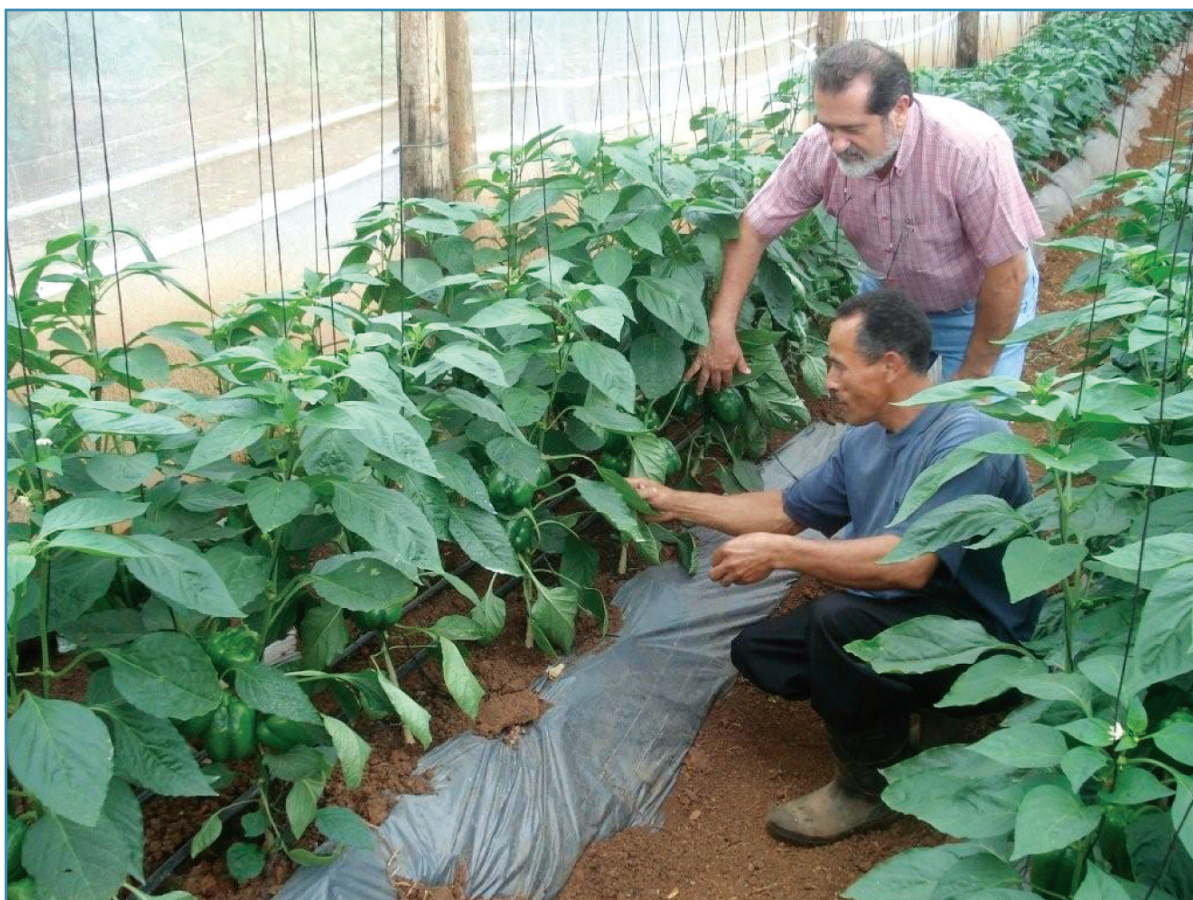
Cultivo del Pimiento Morrón bajo la tecnología de una Estructura Rústica (madera) de Cultivos Protegidos.