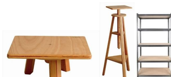
Taburetes modelado de mesa

Propio para ser utilizado tanto para artes plasticas como la mencion de Diseño y creación Artesanal.