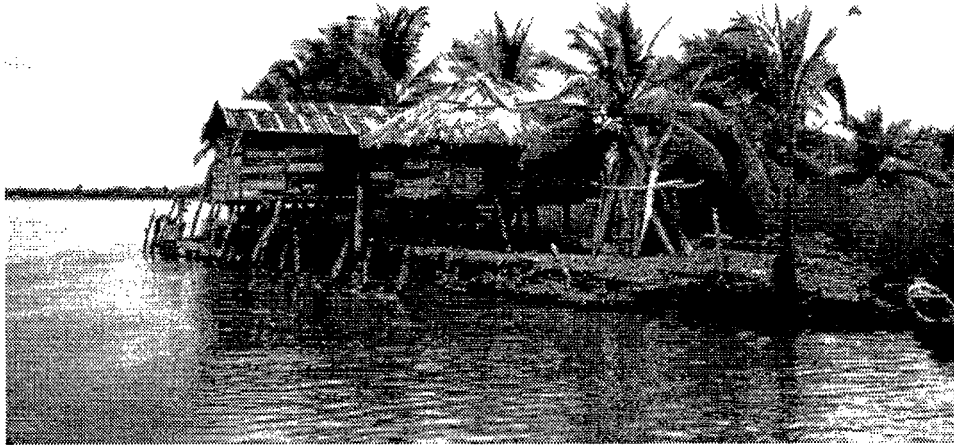
Escena típica rural de un grupo de casas en un estuario de la región de la costa Pacífica colombiana.

Typical scene of a group of houses along an estuary in the Colombian Pacific coast region.