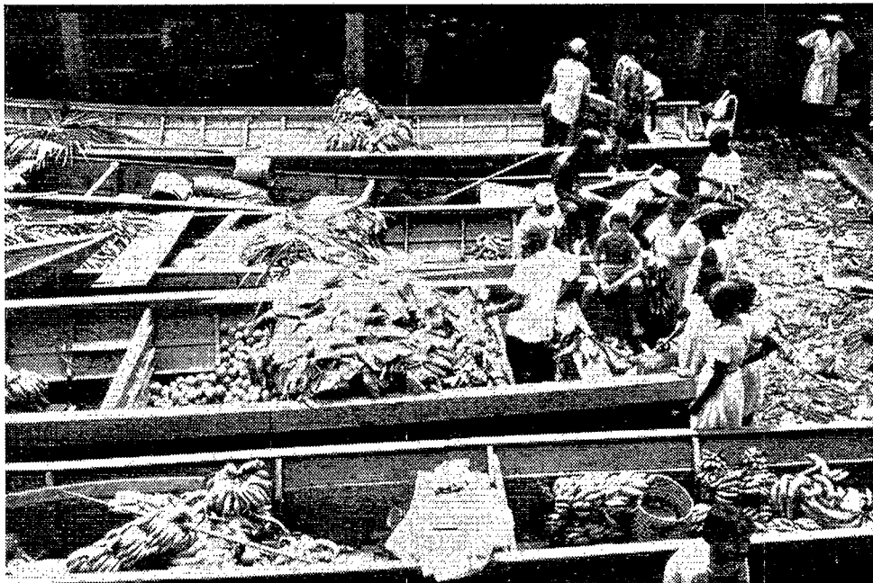
Mercado en el municipio de Guapi, departamento del Cauca.

Typical scene of a group of houses along an estuary in the Colombian Pacific coast region.