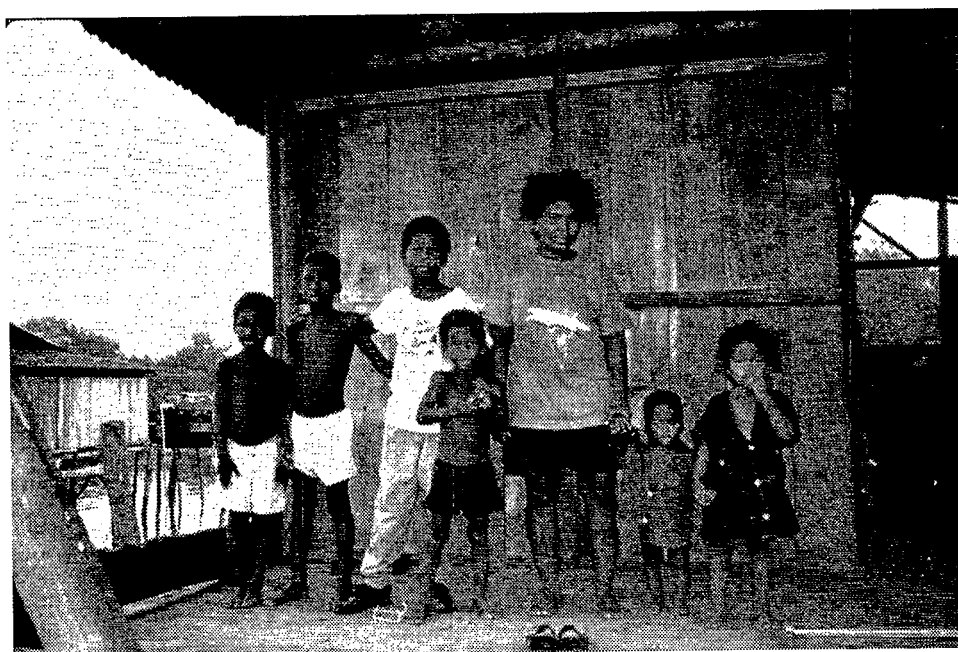
Familia enfrente su casa del municipio de Mosquera, departamento de Nariño.

Water collection system in the municipality of Mosquera, department of Nariño.