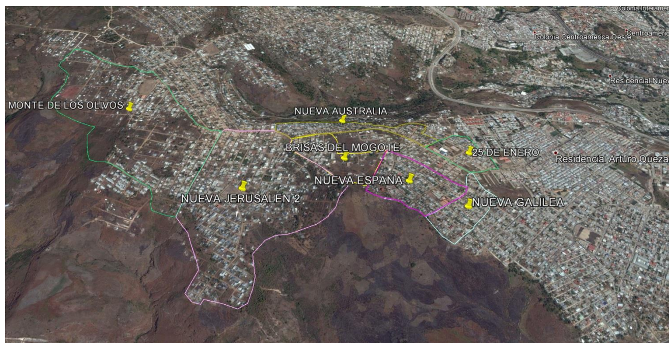
Figura 3 - Ubicación de los 7 barrios