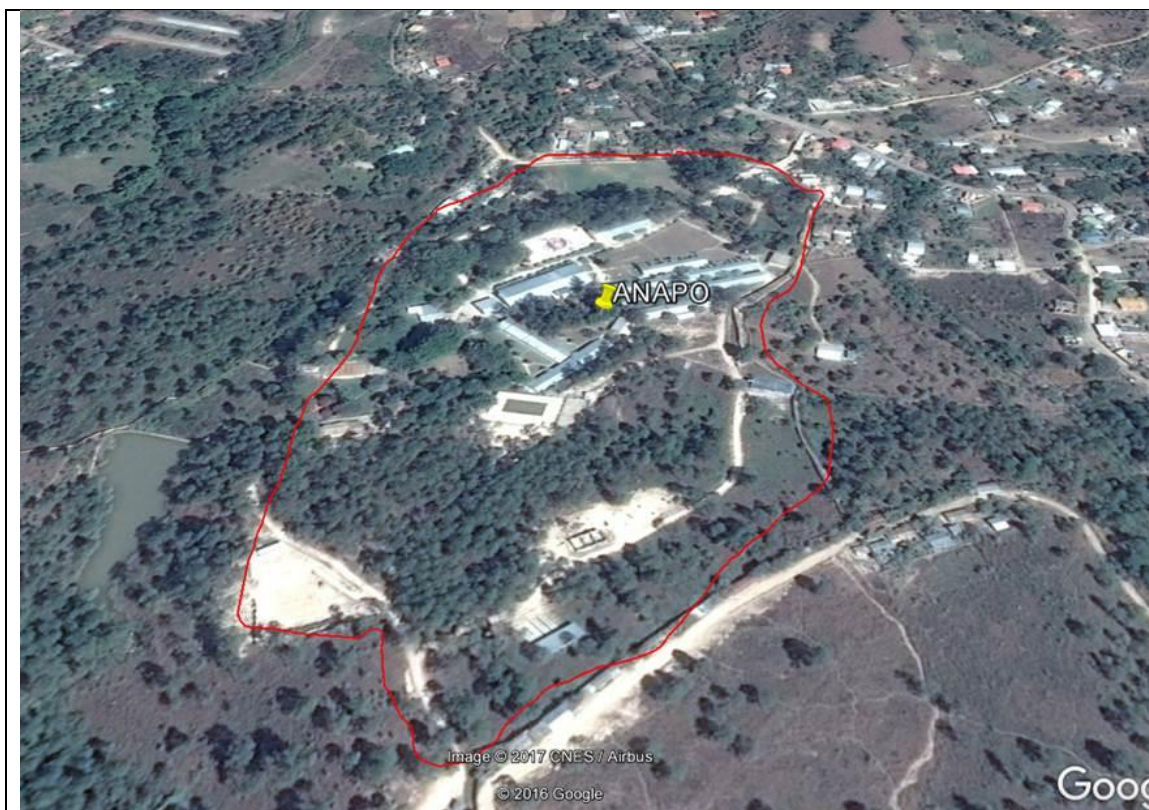
Figura 2- Ubicación del terreno donde se realizará la rehabilitación de la ANAPO