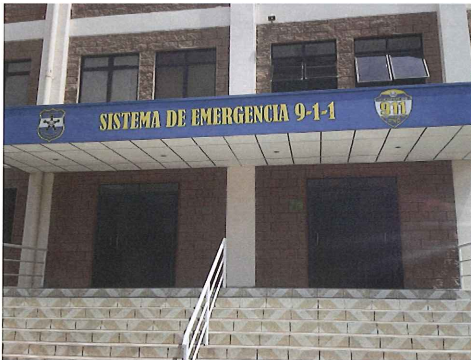
Fachada del edificio.