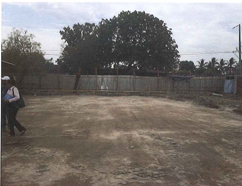
Panorámica del terreno.