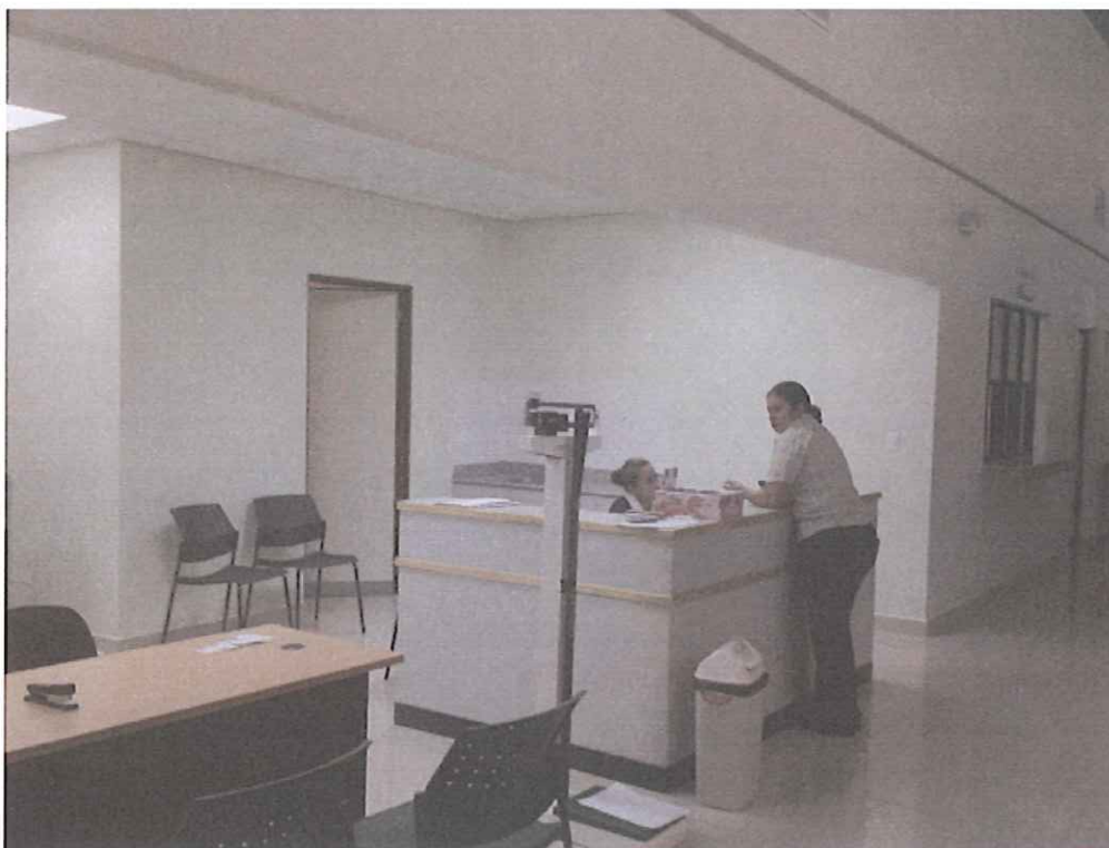
Centro en Funcionamiento.