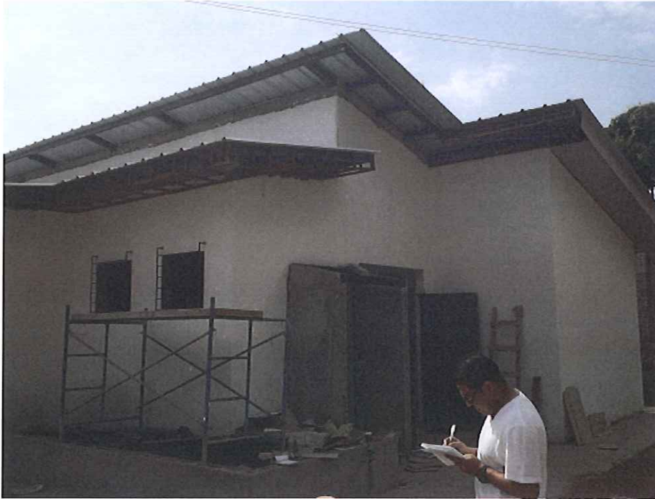
Panorámicas del proceso de finalización de la obra.