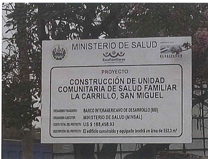
Rótulo del Proyecto.