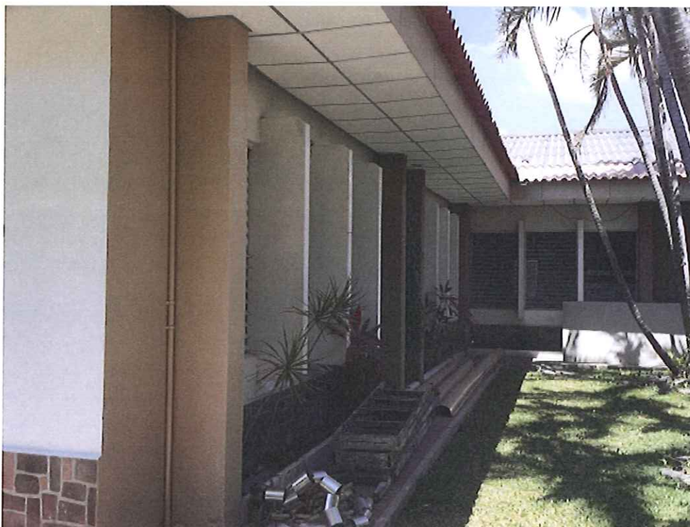
Fachadas en proceso de terminación.