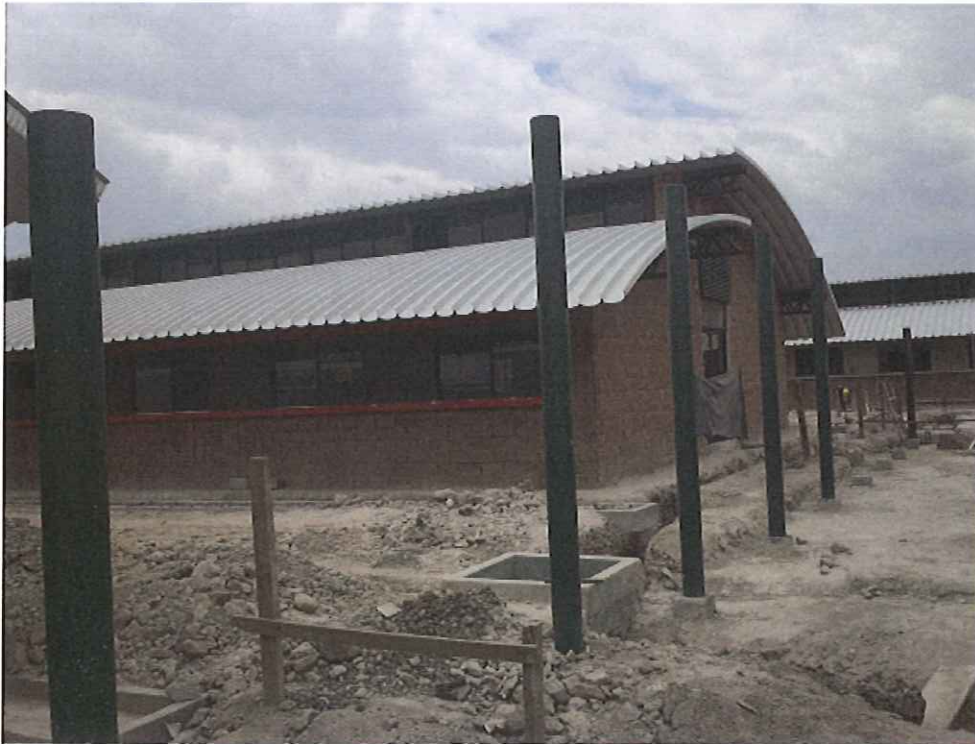
Panorámica externa del proyecto.