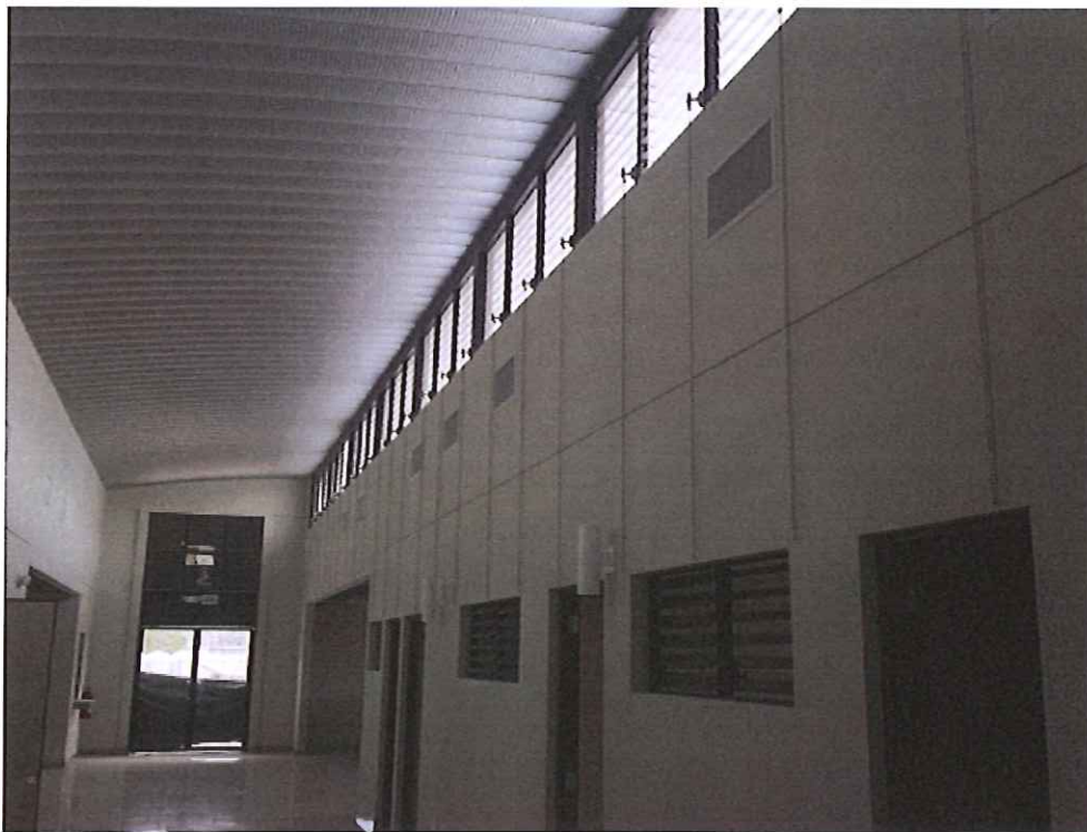
Panorámica interna de las instalaciones.