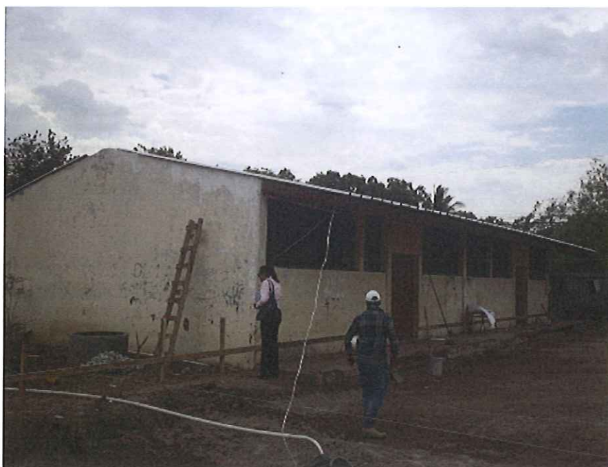
Casa comunal existente que se incorporará a la Unidad.