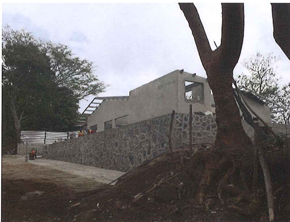
Se observa atraso en el avance.