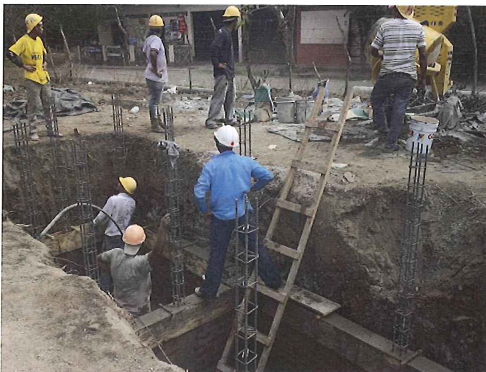
Construcción de Fosa Séptica.