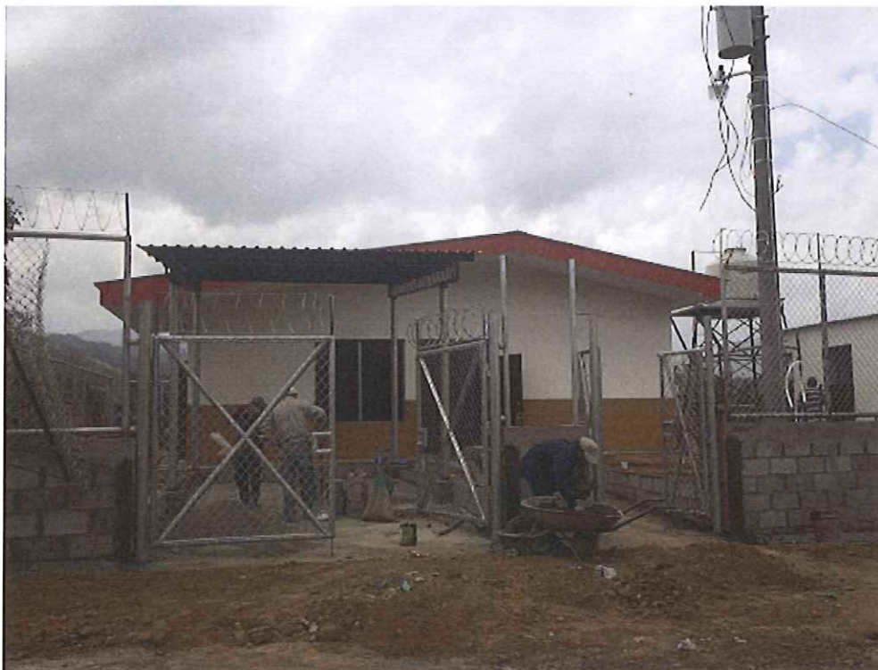
Frente del proyecto que debería mejorarse con su pavimentación.