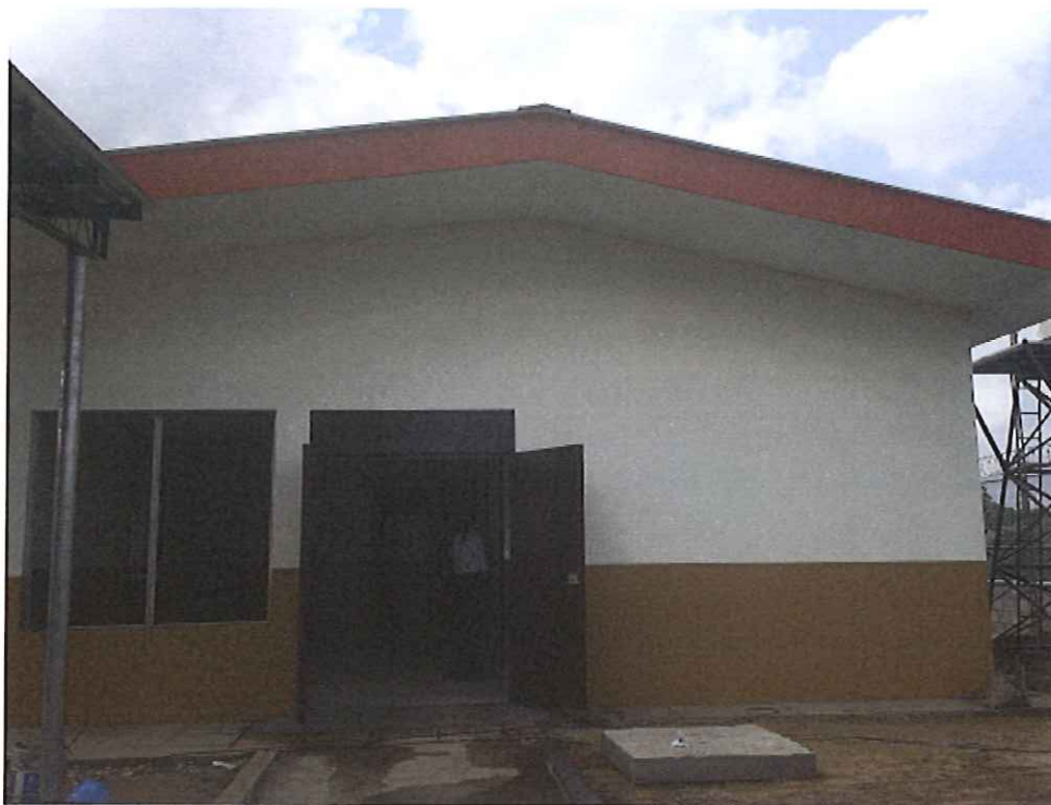
Panorámica de la obra en su fase de finalización.