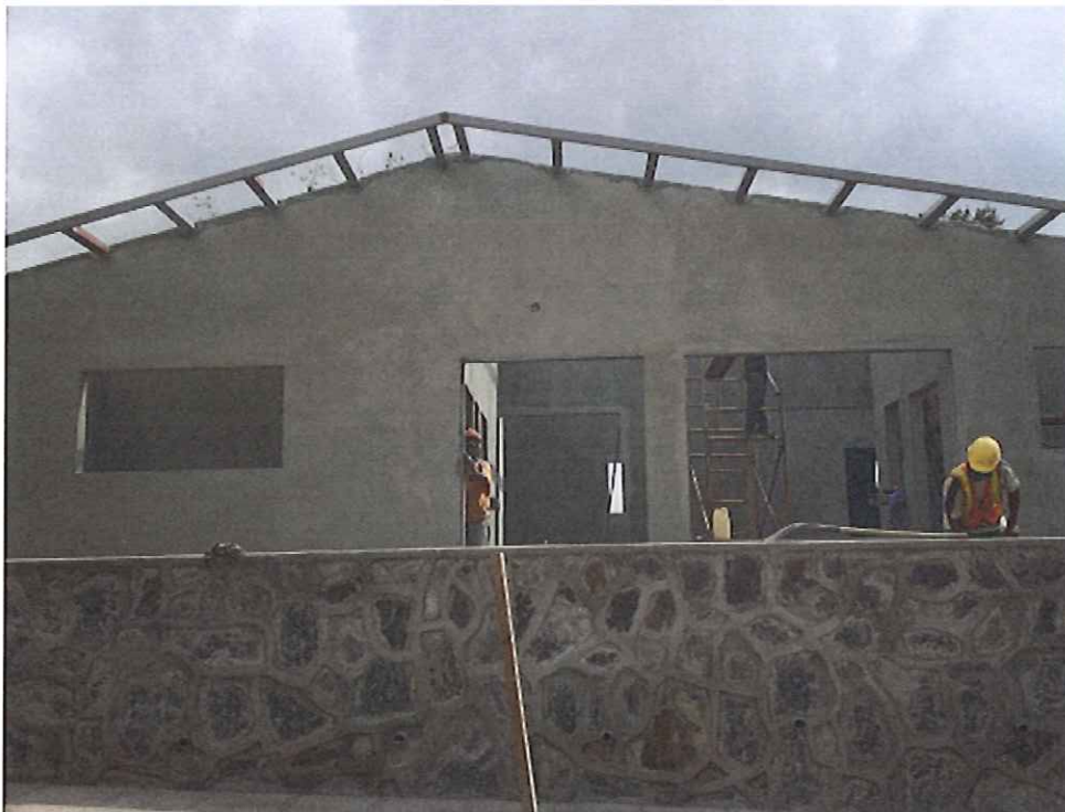
Panorámica de la obra.