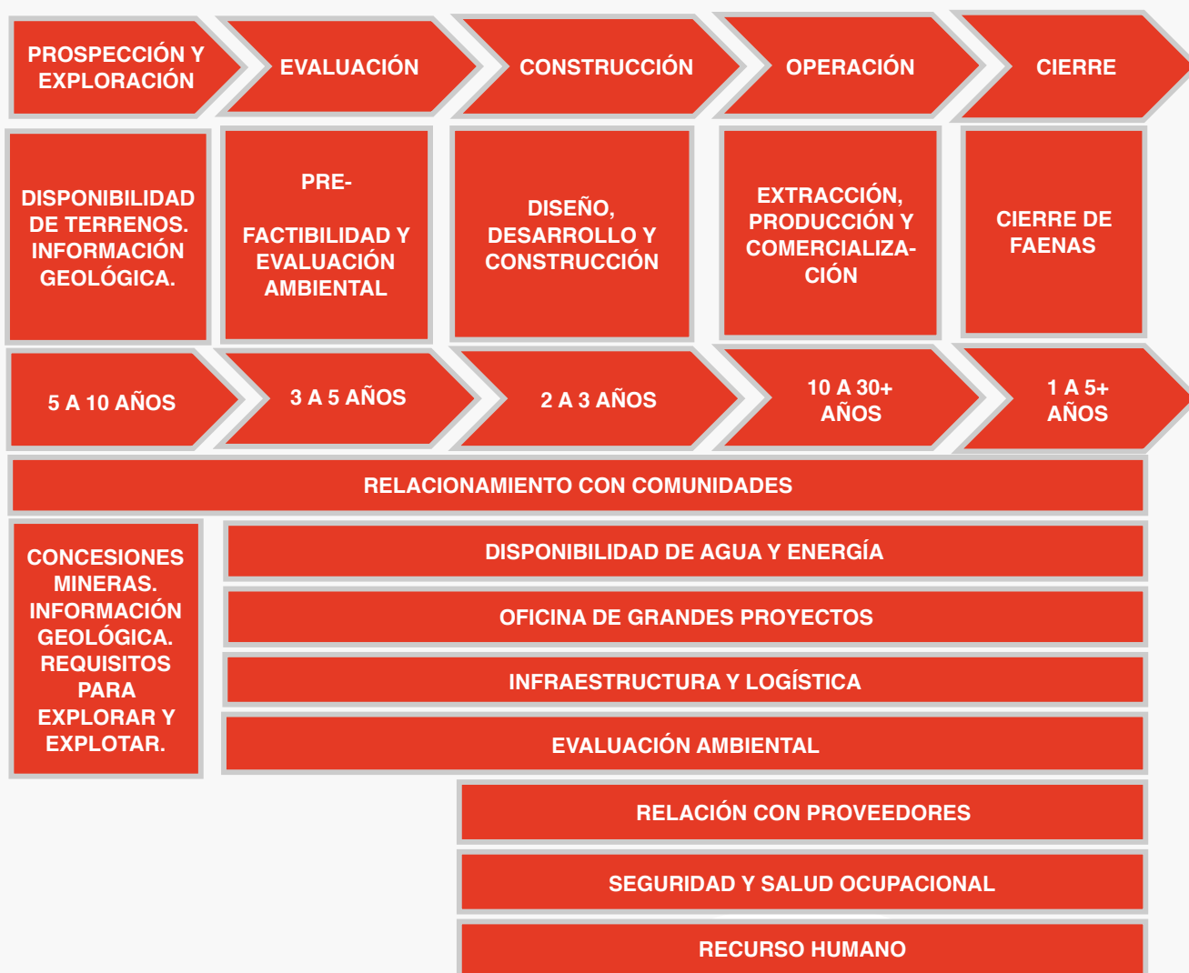
Figura 1. Institucionalidad minera: áreas críticas.

bloque puede avanzar más allá del protocolo comercial acordado, abordando una estrategia conjunta de negociación con socios comerciales extrabloque que maximice su apertura y competencia. Esto debe acordarse institucionalmente y con visión estratégica, sin perjuicio de instrumentos específicos para proveedores locales.