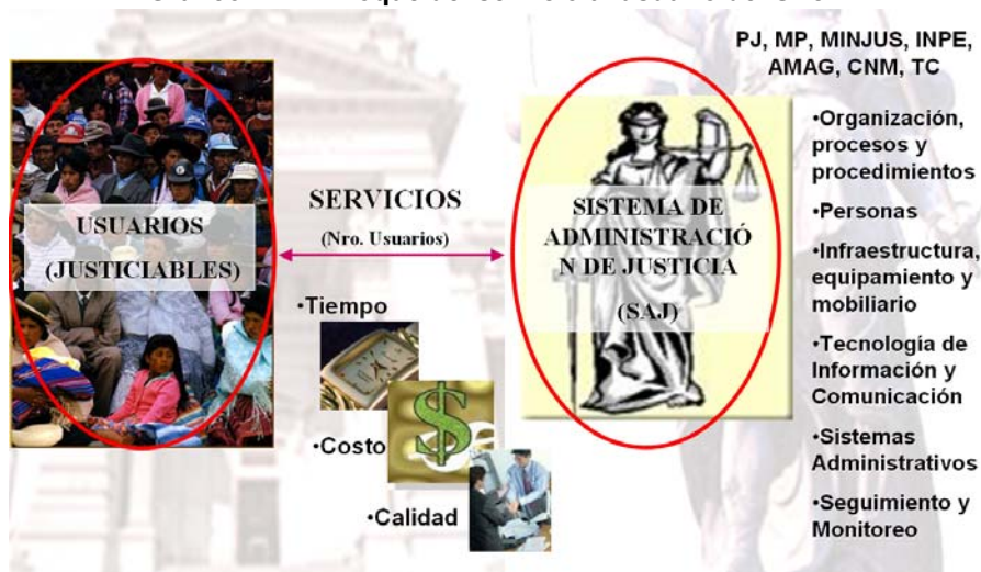
Cuadro 4: Optimización del uso de los recursos público