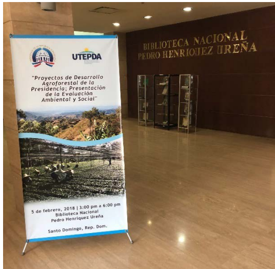
El lugar de la consulta fue la Biblioteca Nacional Pedro Henríquez Ureña, en Santo Domingo