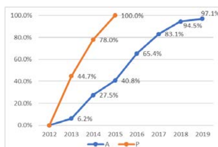
Gráfico 2. Ejecución de Recursos Planeada y Efectiva