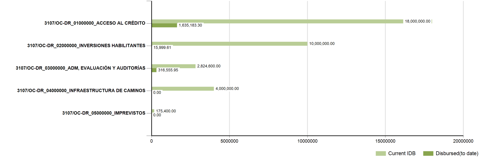
Expense Categories by Loan Contract (cumulative values)