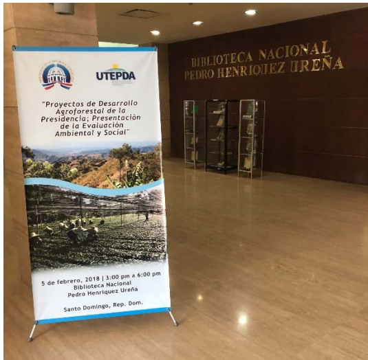
El lugar de la consulta fue la Biblioteca Nacional Pedro Henríquez Ureña, en Santo Domingo