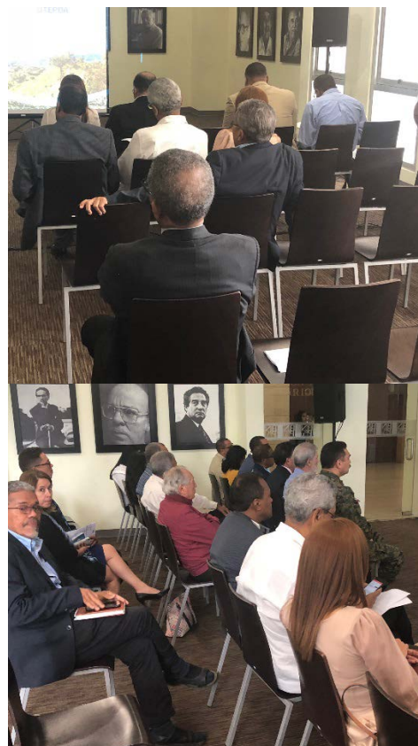
La asistencia fue significativa