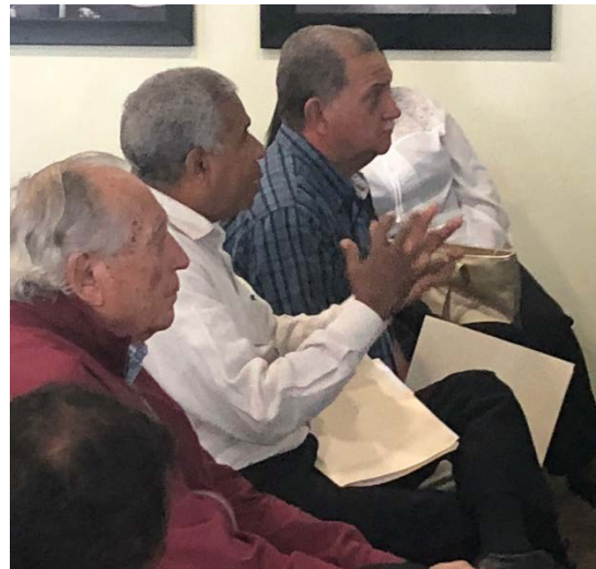
Los participantes realizaron preguntas y comentarios con un alto contenido técnico