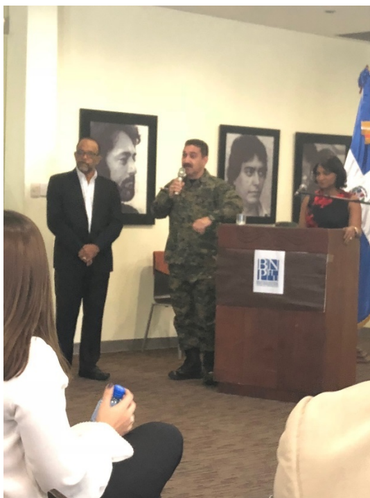
Las preguntas y comentarios fueron respondidos tanto por los responsables de UTEPDA, como por el consultor