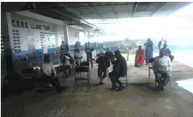
Momentos de la reunión en Llano Tugrí, Comarca Ngäbe Buglé