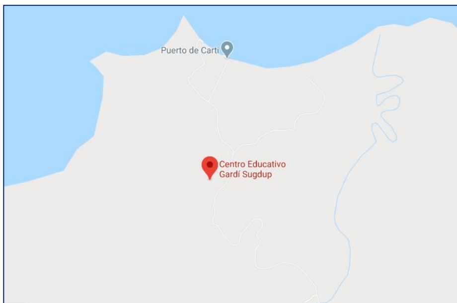
Localización regional del proyecto, ubicado en Gardí Sugdup, Comarca Guna Yala