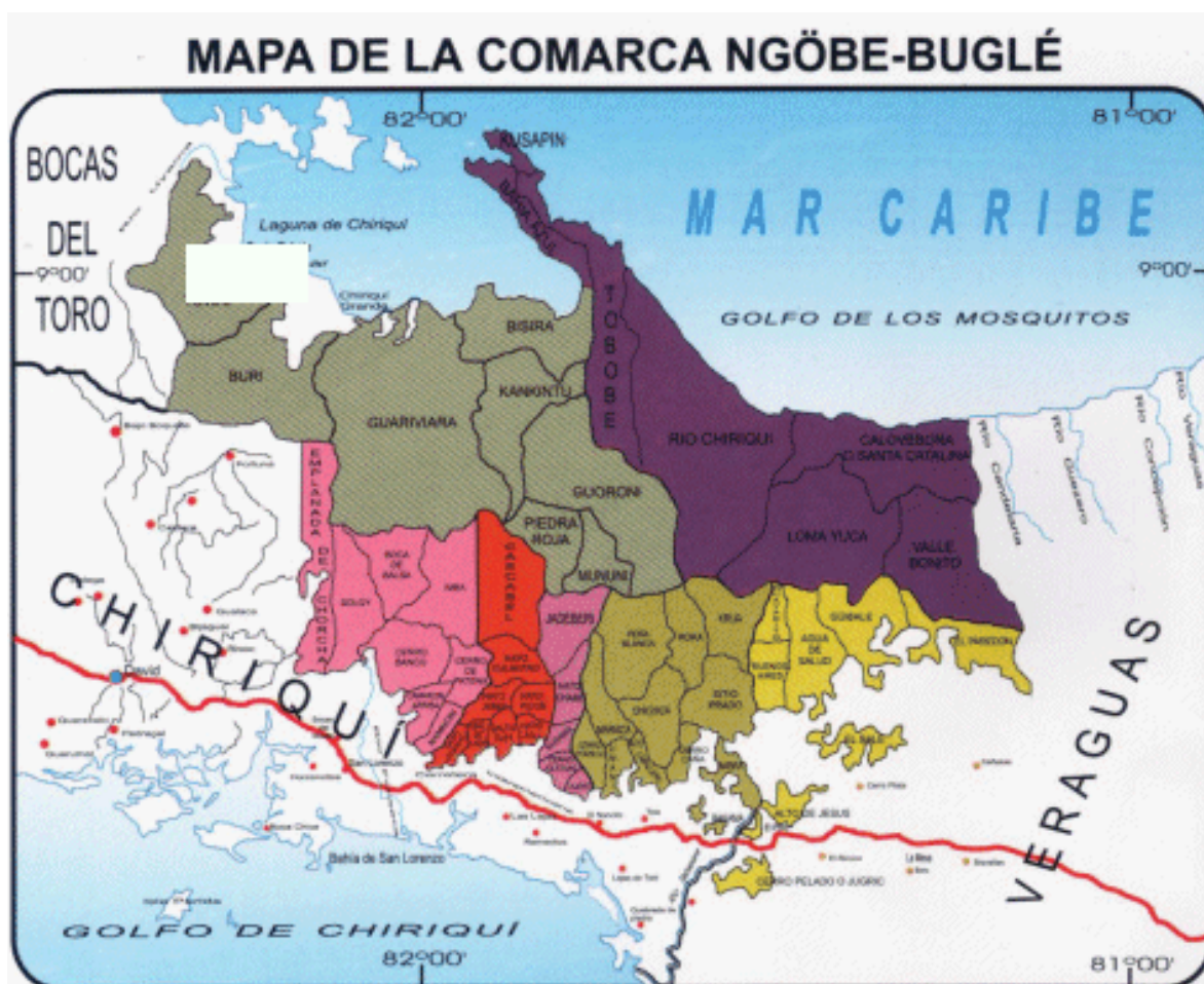
Mapa 2 Comarca Ngäbe-Buglé – CNB