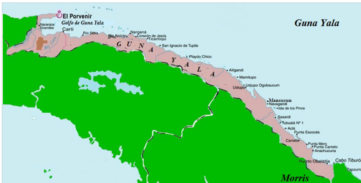
Mapa 4 Comarca Gunayala