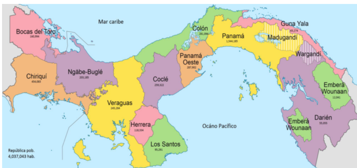
Mapa 1 República de Panamá. División Provincias y Comarcas