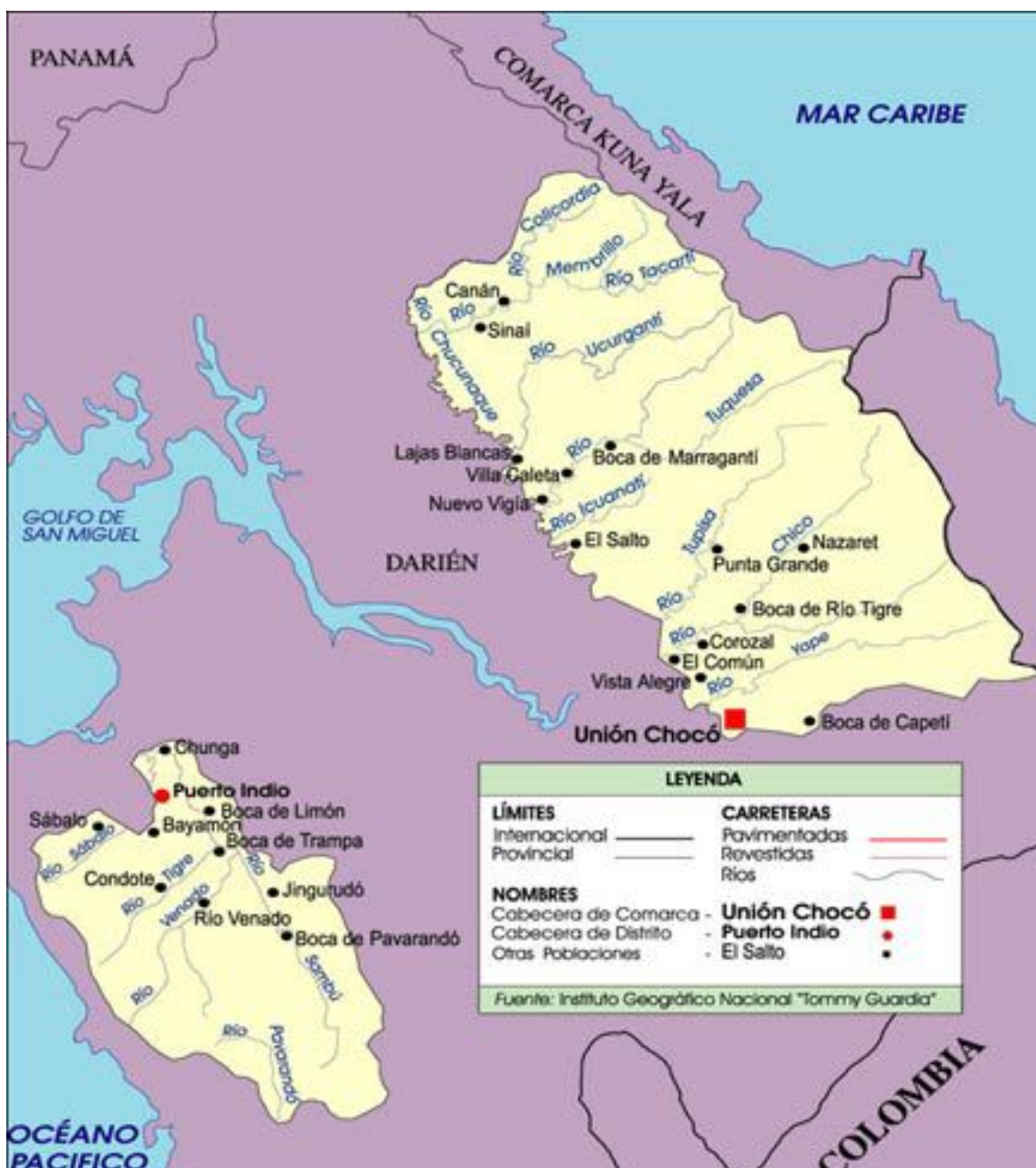
Mapa 3 Comarca Emberá Waunaan