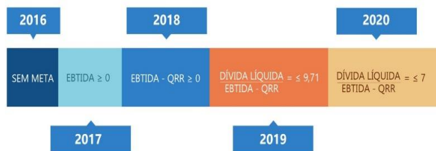
Gráfico 2 - Metas financieras de Celesc-D

El contrato de concesión requiere el cumplimiento anual de indicadores financieros que garanticen la sostenibilidad de la empresa, los cuales se resumen en el siguiente gráfico.