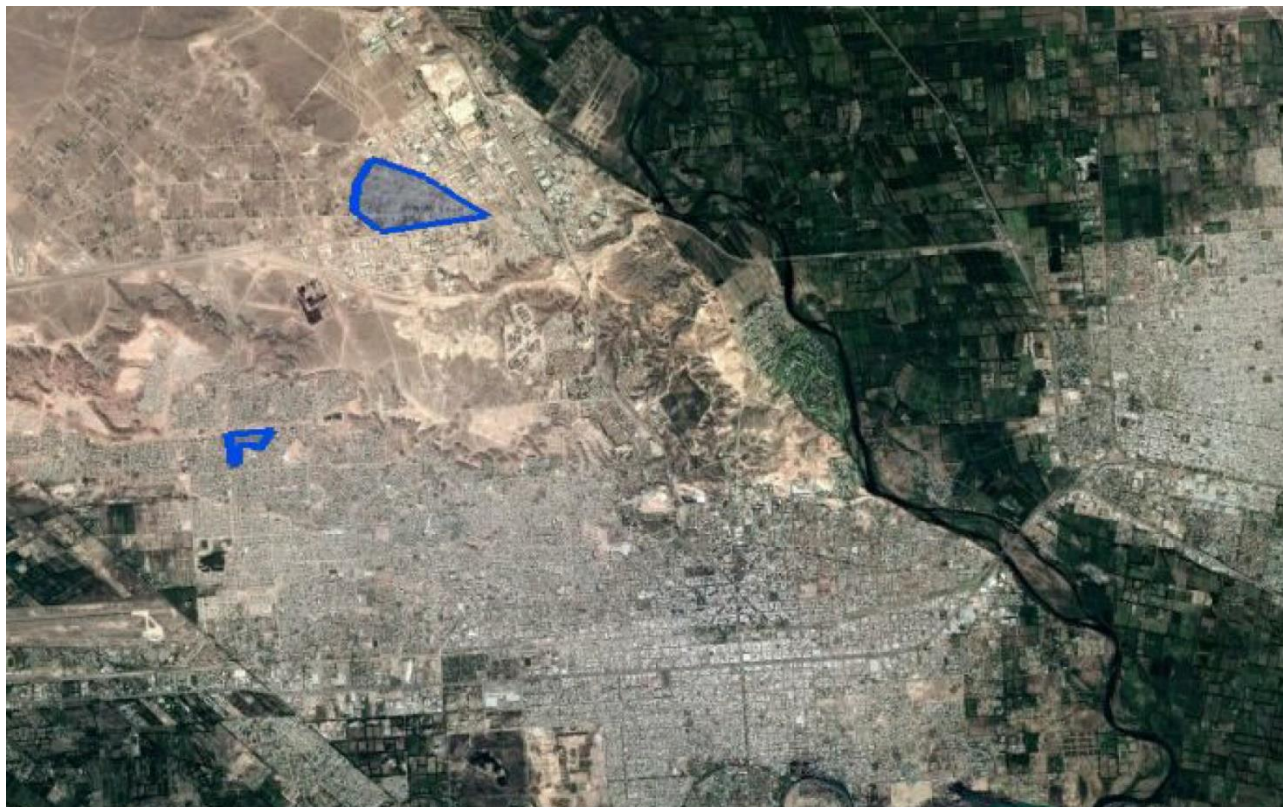
Mapa 6. Ubicación de los barrios en la ciudad de Neuquén, provincia de Neuquén