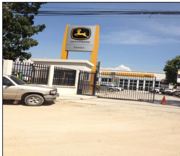
Imagen 3. CAMOSA/SPS, Empresas en los alrededores del terreno donde se ubicara la subestacion.