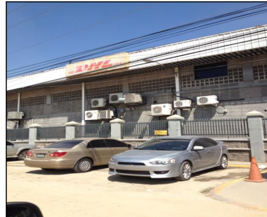
Imagen 2. DHL empresas en los alrededores de la subestación.