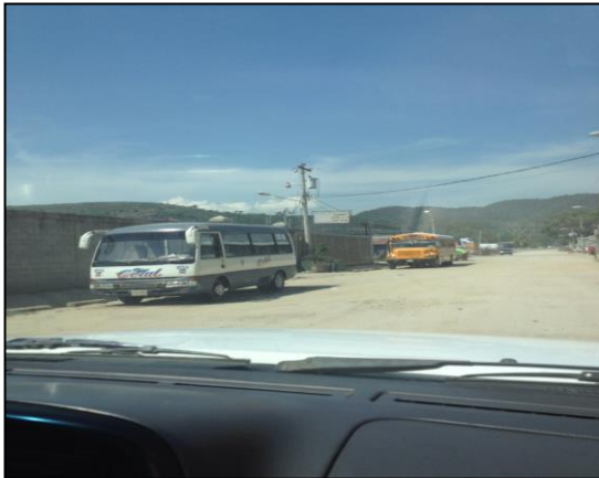
Imagen 1. Terminal Ruta No. 2 en la zona de calpules.