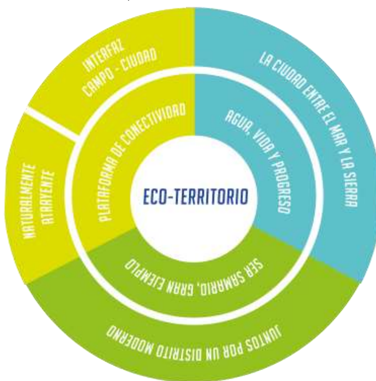
Esquema del Plan de Acción

Con esto en mente, el Plan de Acción se estructura a partir de 7 líneas estratégicas interrelacionadas, que se desarrollan en programas y acciones incrementales en una ruta de 15 años, con dos hitos, el primero al año 2025 aprovechando la celebración de los 500 años de fundación, y el segundo al 2030 entorno a la conmemoración de los 200 años de la muerte de Simón Bolívar en la Quinta de San Pedro Alejandrino.