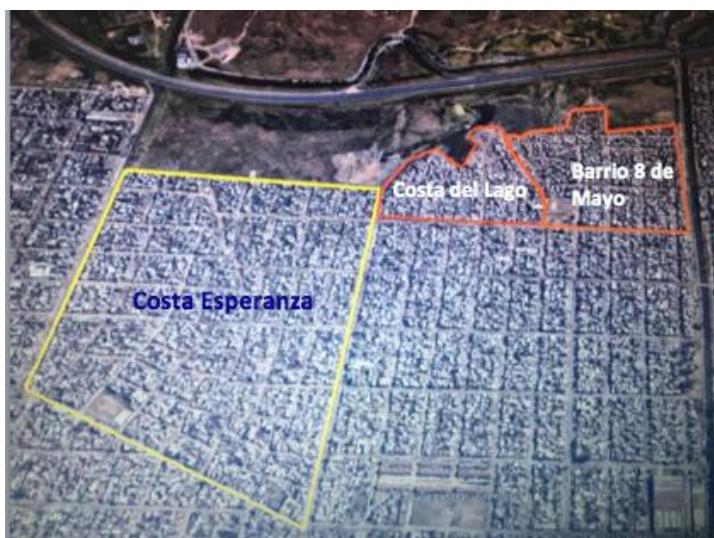
Ilustración 2- Barrios Costa Esperanza, Costa del Lago y 8 de Mayo, municipio de San Martín.