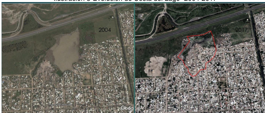
Ilustración 3-Evolución de Costa del Lago- 2004-2017

El organismo que coordinará el Programa (Organismo Provincial de Integración Social y Urbana - OPISU) es de reciente creación (enero de 2018). Si bien sus integrantes poseen experiencia