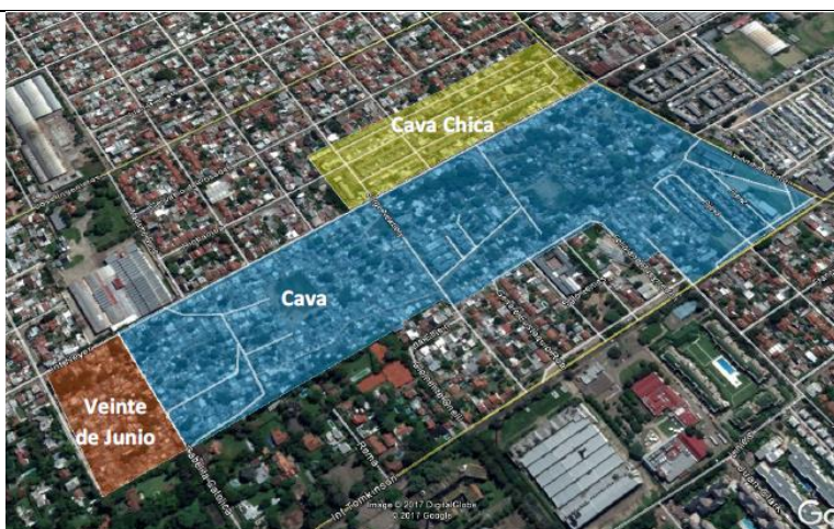
Mapa 5. Polígono de intervención. Villa La Cava, Municipio de San Isidro.

Barrio Libertad y Don Orione Viejo es un barrio de borde situado en el segundo cordón del GBA, en la localidad de Don Orione del Municipio de Almirante Brown y posee una superficie aproximada de 47,6 has. No se tienen datos acerca de la cantidad de viviendas que posee. Se encuentra delimitado por las calles, Córdoba, Rinaldi, 25 de mayo y Sánchez Gardel, Barrio Suther, Barrio Los Altos del Castillo y Barrio Esther.