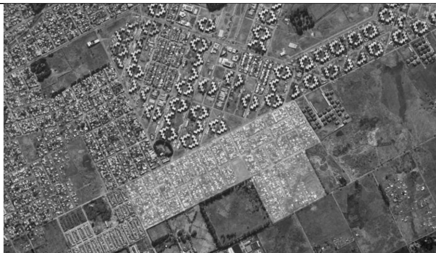
Mapa 4. Polígono de intervención. Barrio Libertad, Municipio de Almirante Brown.

Barrio Libertad y Don Orione Viejo es un barrio de borde situado en el segundo cordón del GBA, en la localidad de Don Orione del Municipio de Almirante Brown y posee una superficie aproximada de 47,6 has. No se tienen datos acerca de la cantidad de viviendas que posee. Se encuentra delimitado por las calles, Córdoba, Rinaldi, 25 de mayo y Sánchez Gardel, Barrio Suther, Barrio Los Altos del Castillo y Barrio Esther.