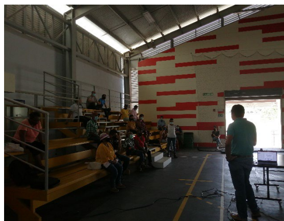
Presentación del Punto Focal a los asistentes