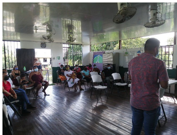
Presentación del Punto Focal a los asistentes