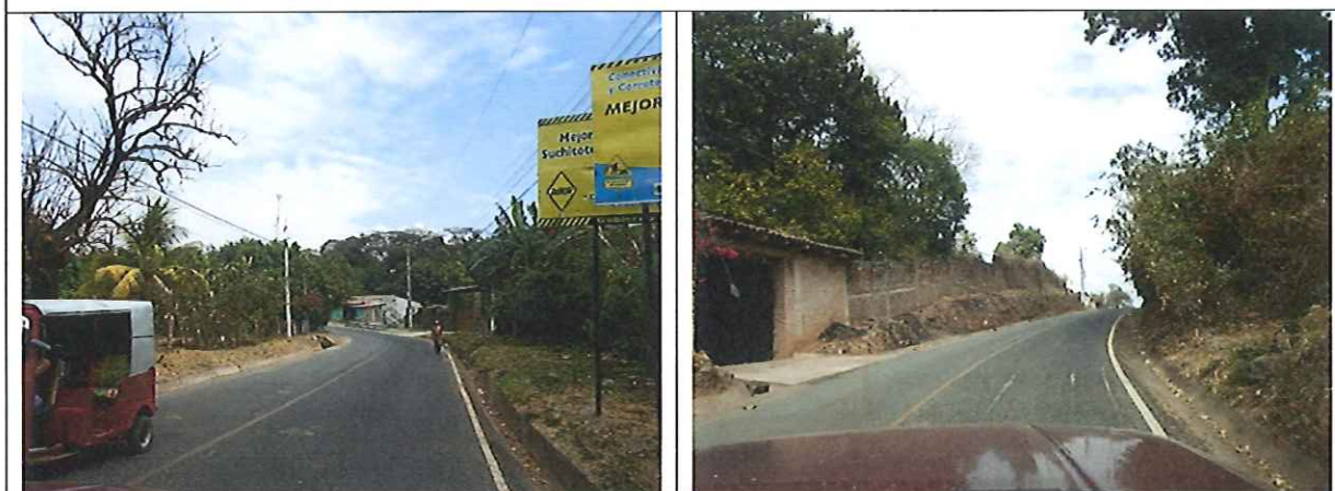
Fotografías que muestran el inicio del proyecto en Suchitoto hacia Cinquera