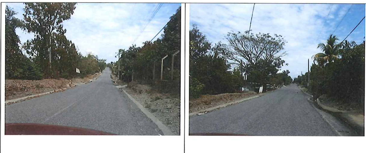
Fotografías que muestran la Muy Buena transitabilidad del proyecto