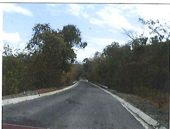
Fotografías que muestran la Muy Buena transitabilidad del proyecto