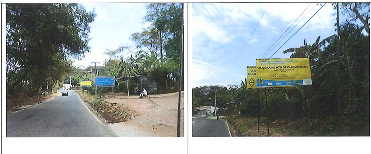
Fotografías que muestran el inicio del proyecto en Suchitoto