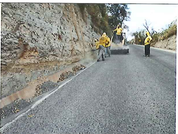
Fotografías que muestran al contratista realizando limpieza de cunetas en los tramos intervenidos con doble tratamiento