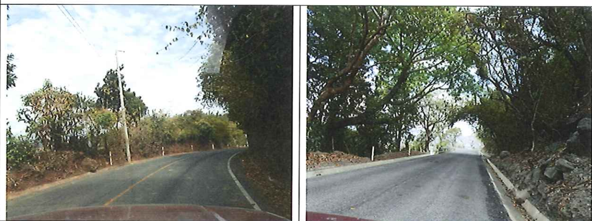
Fotografías que muestran la Muy Buena transitabilidad del proyecto