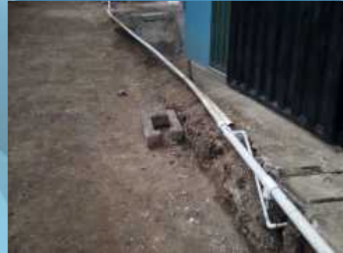
CORTE DE SERVICIO DE AGUA POTABLE